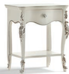
1033T Comodino / Night Table L. 57 P. 40 H. 68 Venere Collection / pag. 111