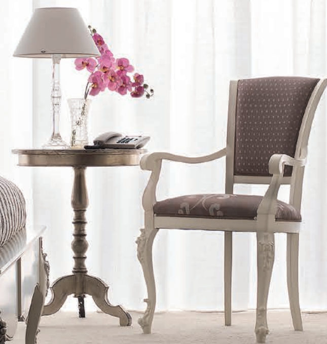
Art. 1004T Sedia / Chair L. 54 P. 59 H. 101