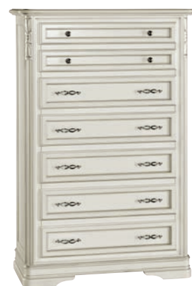
626T Cassettiera / Chest of drawers L. 85 P. 42 H. 128 Marco Polo Collection / pag. 105