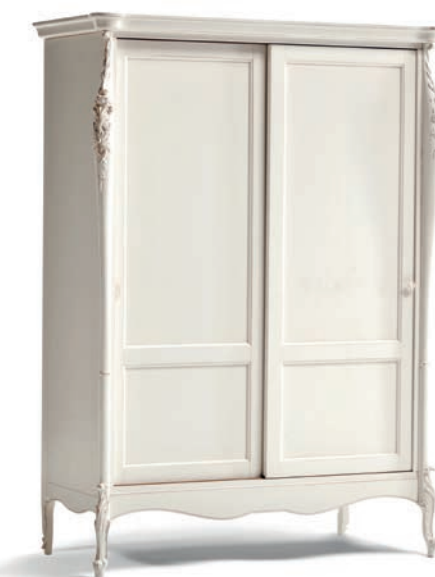
1042T Armadietto due ante scorrevoli / Sliding two doors small wardrobe L. 148 P. 67 H. 204 Venere Collection / pag. 137