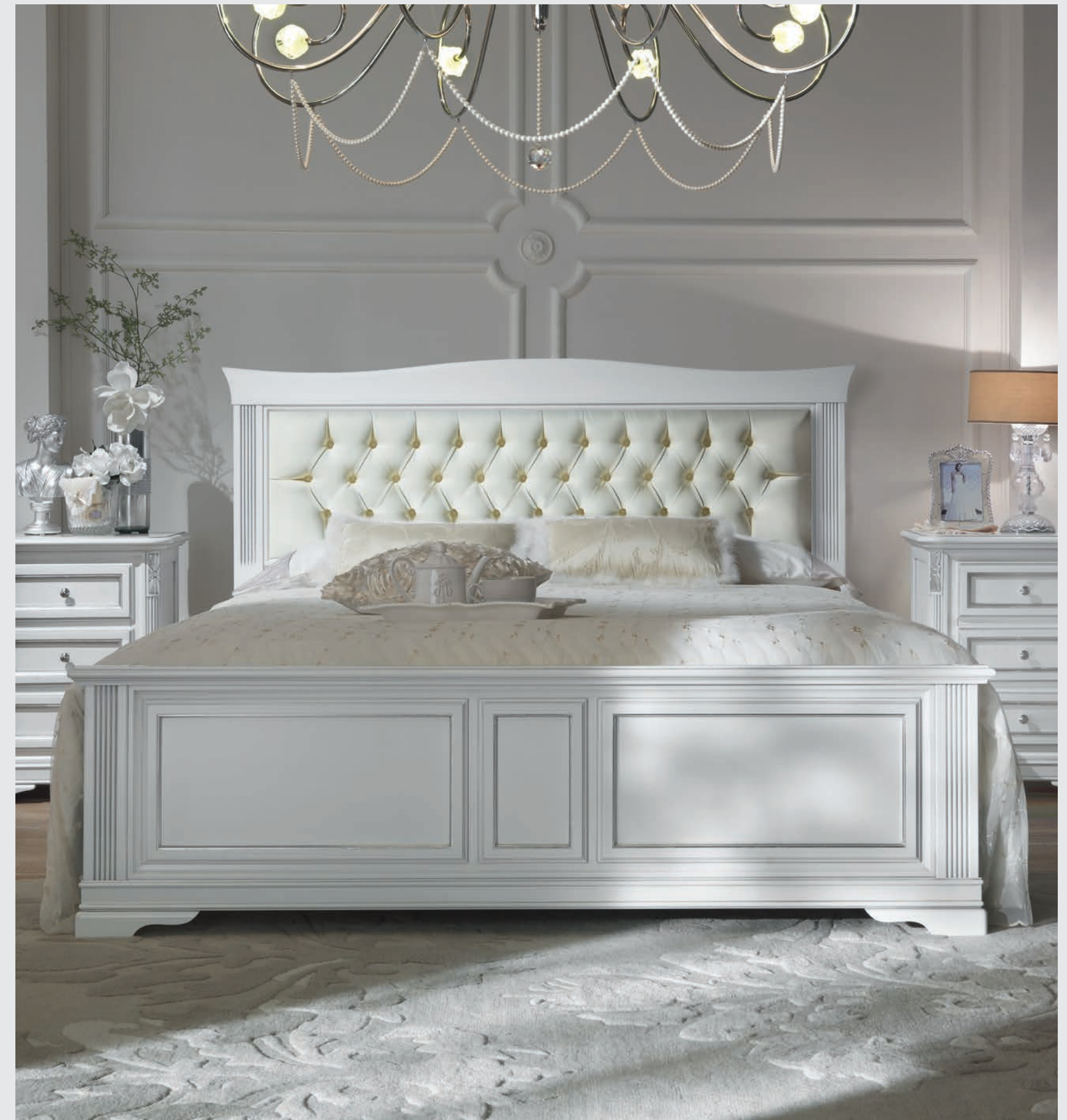
Art. 624TE Letto con testata ecopelle / Bed with upholstered headboard L. 176 P. 210 H. 125