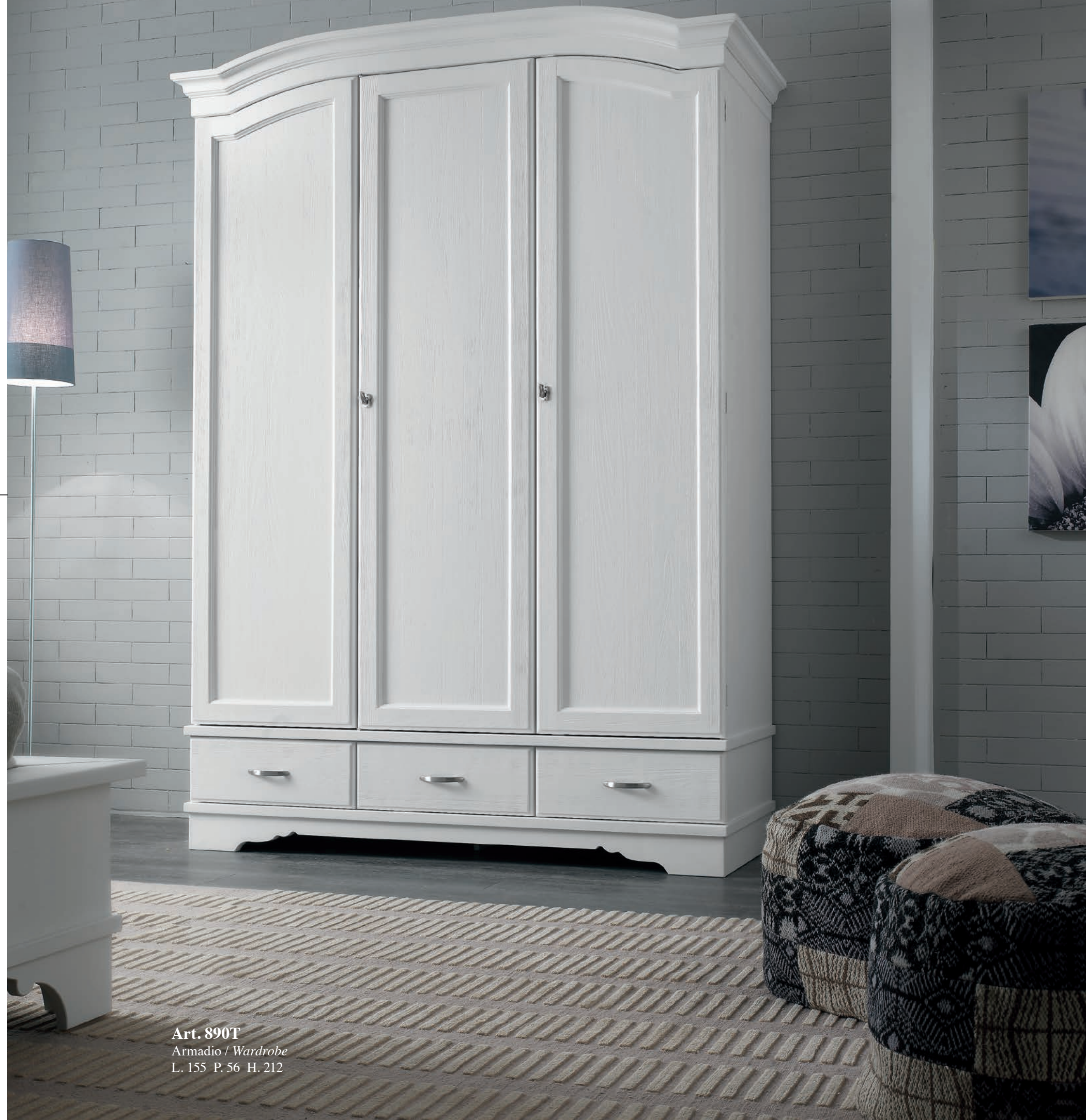
Art. 890T Armadio / Wardrobe L. 155 P. 56 H. 212