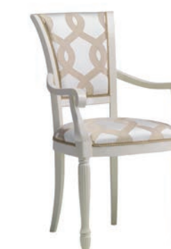
6085T Sedia capotavola / Arm-chair L. 63 P. 56 H. 99 Marco Polo Collection / pag. 105