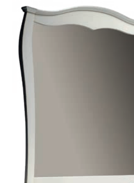
1769T Specchiera / Mirror L. 105 P. 10 H. 114