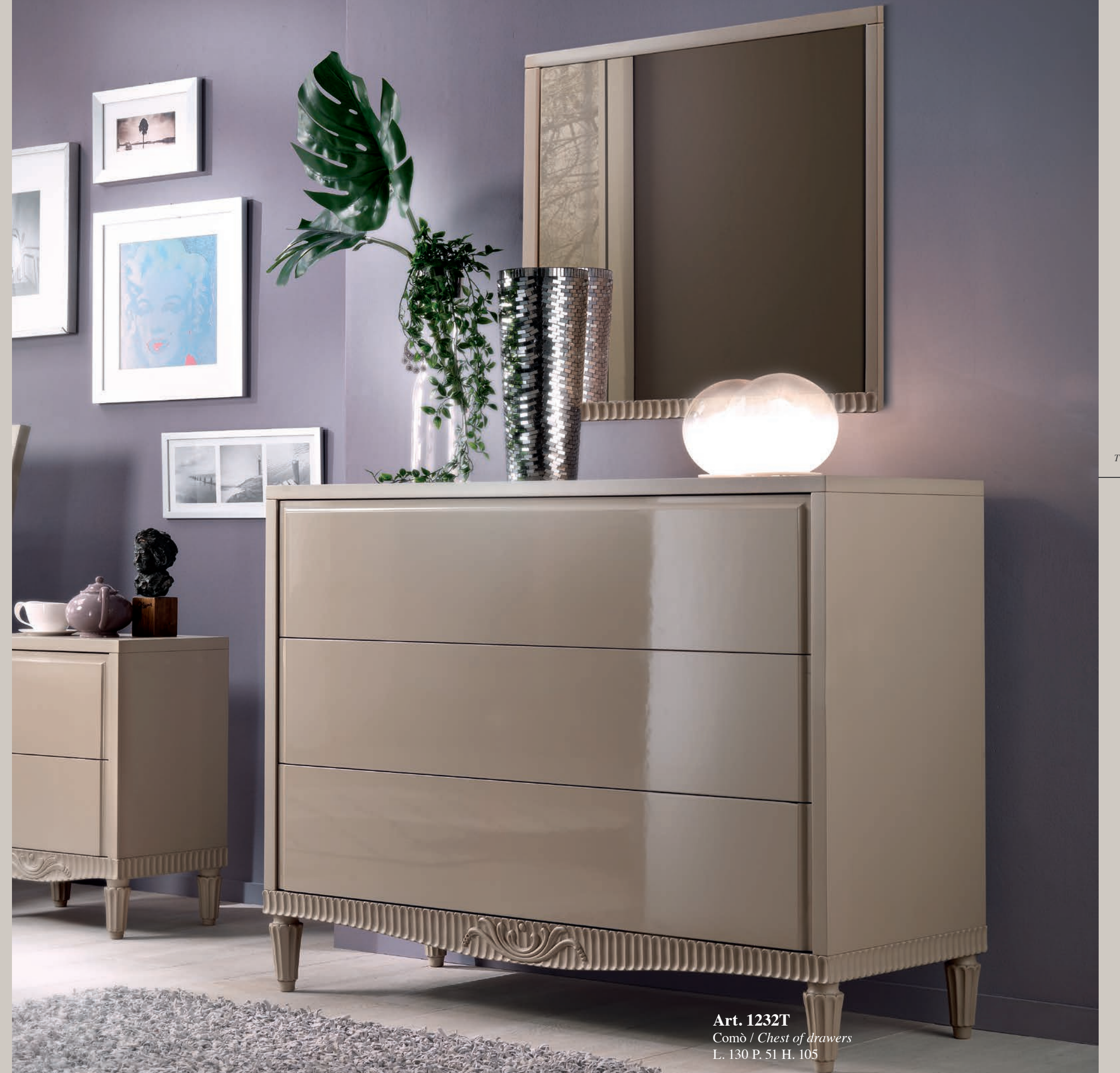
Art. 1232T Comò / Chest of drawers L. 130 P. 51 H. 105