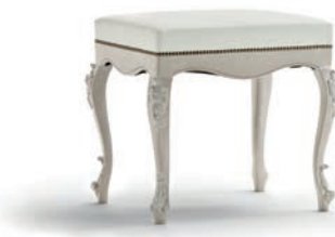
1039T Panchetta / Bench L. 60 P. 50 H. 54 Venere Collection / pag. 121