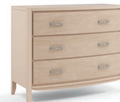
2032T Comò / Chest of drawers Decoro Onda L. 130 P. 53 H. 105