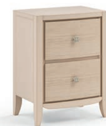
2029T Comodino / Night table Decoro Onda L. 50 P. 37 H. 67