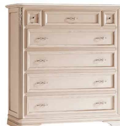
621T Comò con ribalta / Chest of drawers L. 120 P. 51 H. 130