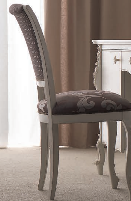
Art. 1016T Pannello Attaccapanni / Panel Clothes Hanger L. 96 P. 6 H. 207