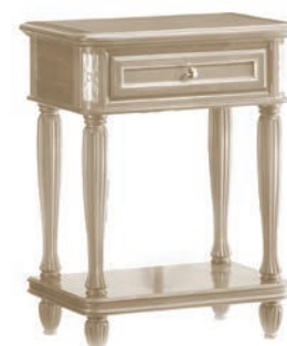
6002T Comodino / Night table L. 55 P. 37 H. 71