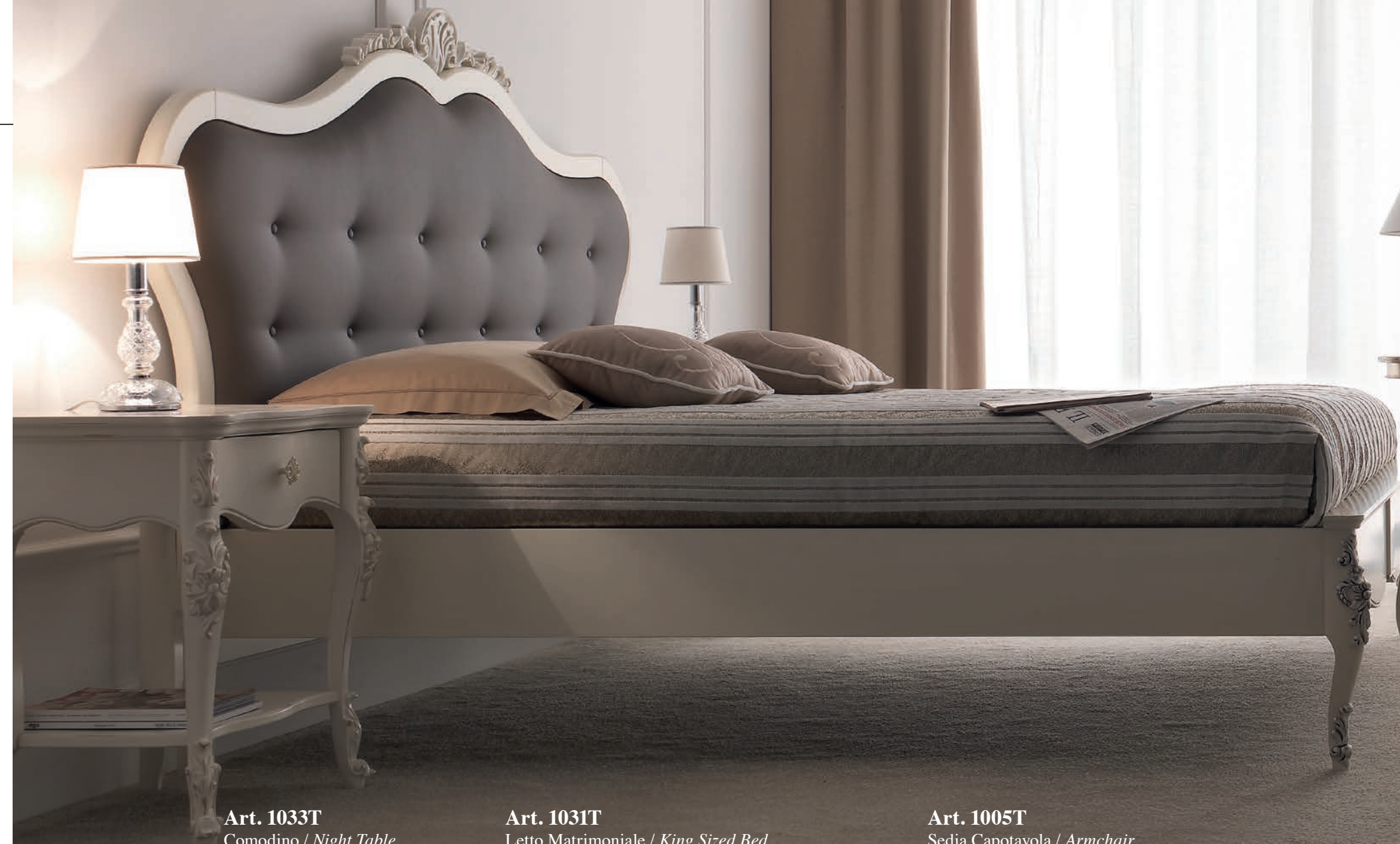
Art. 1033T Comodino / Night Table L. 57 P. 40 H. 68