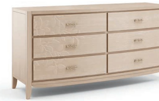
2049TF Comò / Chest of drawers Decoro Foglia L. 180 P. 56 H. 90