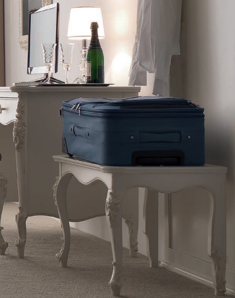
Art. 1044T Portavaligie / Luggage Rest L. 78 P. 47 H. 51