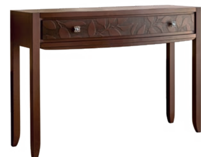
2014TF Consolle / Consolle Decoro Foglia L. 120 P. 40 H. 83 Eden Collection