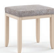
2039T Panchetta / Bench L. 55 P. 44 H. 49 Eden Collection / pag. 48