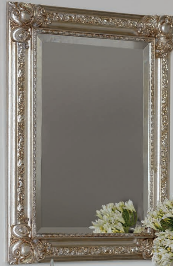
Art. 1023T Consolle / Console L. 90 P. 46 H. 83