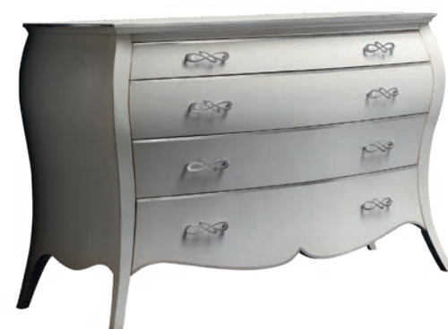
1767T Comò / Chest of drawers L. 143 P. 57 H. 91