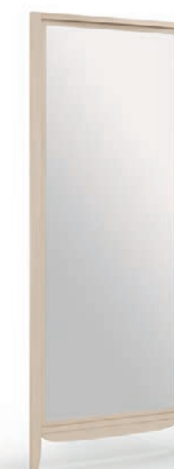
2073T Specchiera grande / Large mirror L. 80 P. 5 H. 200