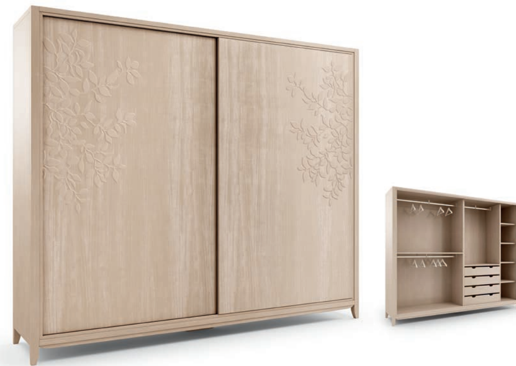
2030TF Armadio scorrevole / Wardrobe with sliding doors Decoro Foglia L. 280 P. 64 H. 250 Eden Collection / pag. 54