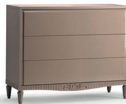
1232T Comò / Chest of drawers L. 130 P. 51 H. 105