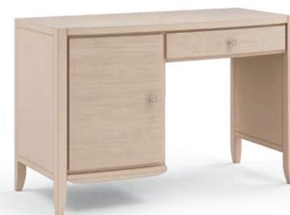
2041T Scrivanie portafriigo / Single pedestal desks Decoro Onda L. 124 P. 56 H. 81