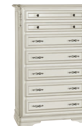
626T Cassettiera / Chest of drawers L. 85 P. 42 H. 128 Marco Polo Collection / pag. 105