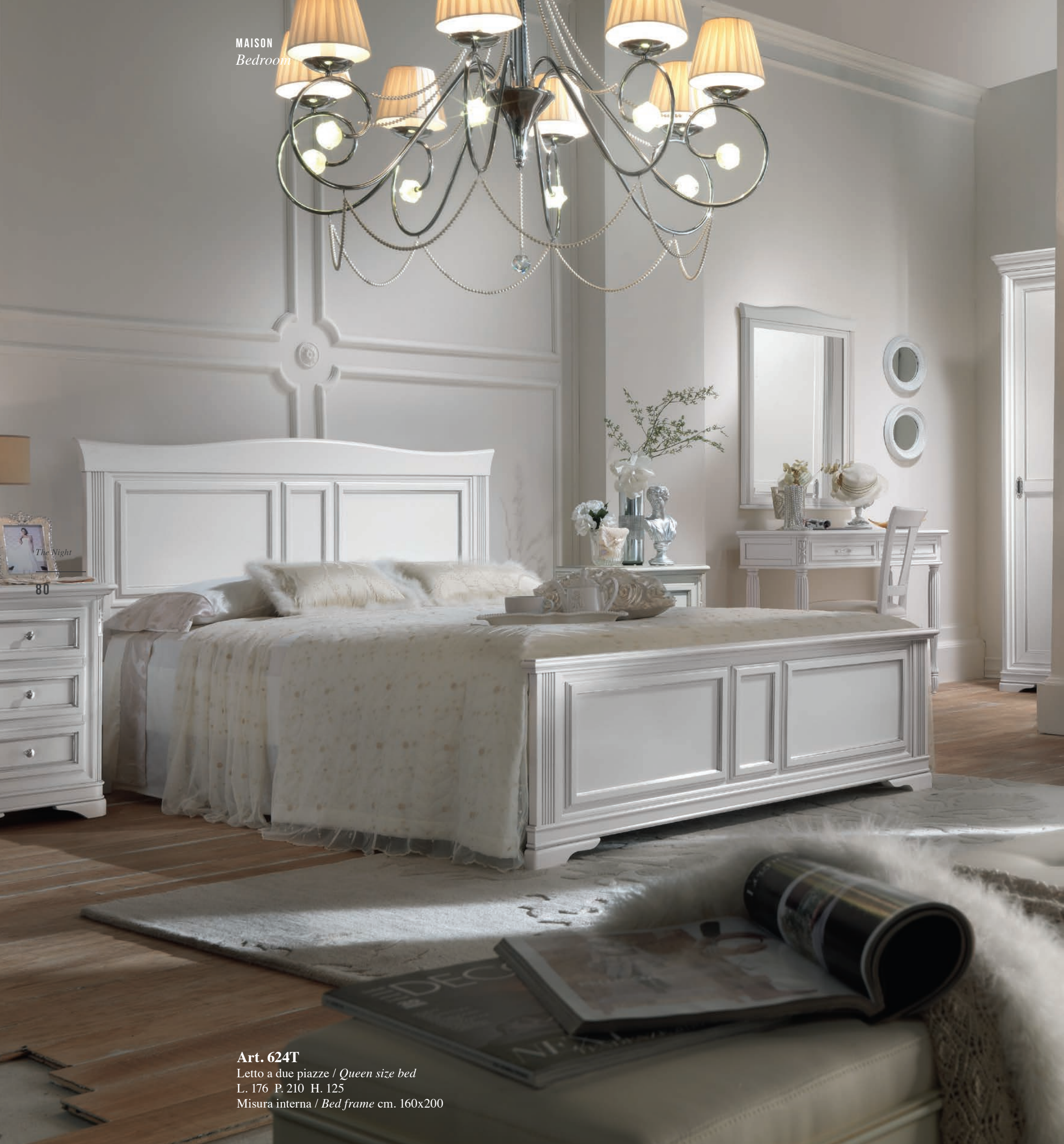
Art. 624T Letto a due piazze / Queen size bed L. 176 P. 210 H. 125 Misura interna / Bed frame cm. 160x200