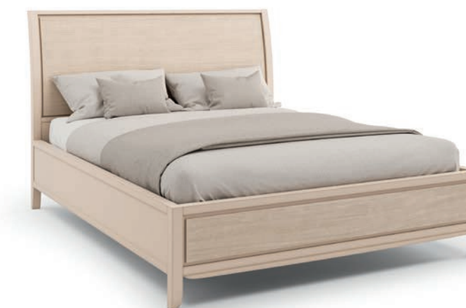
2038T Letti matrimoniali (Rete materasso 160x200 cm) / Double size beds (Bed frame 160x200 cm) Decoro Onda L. 170 P. 219 H. 125