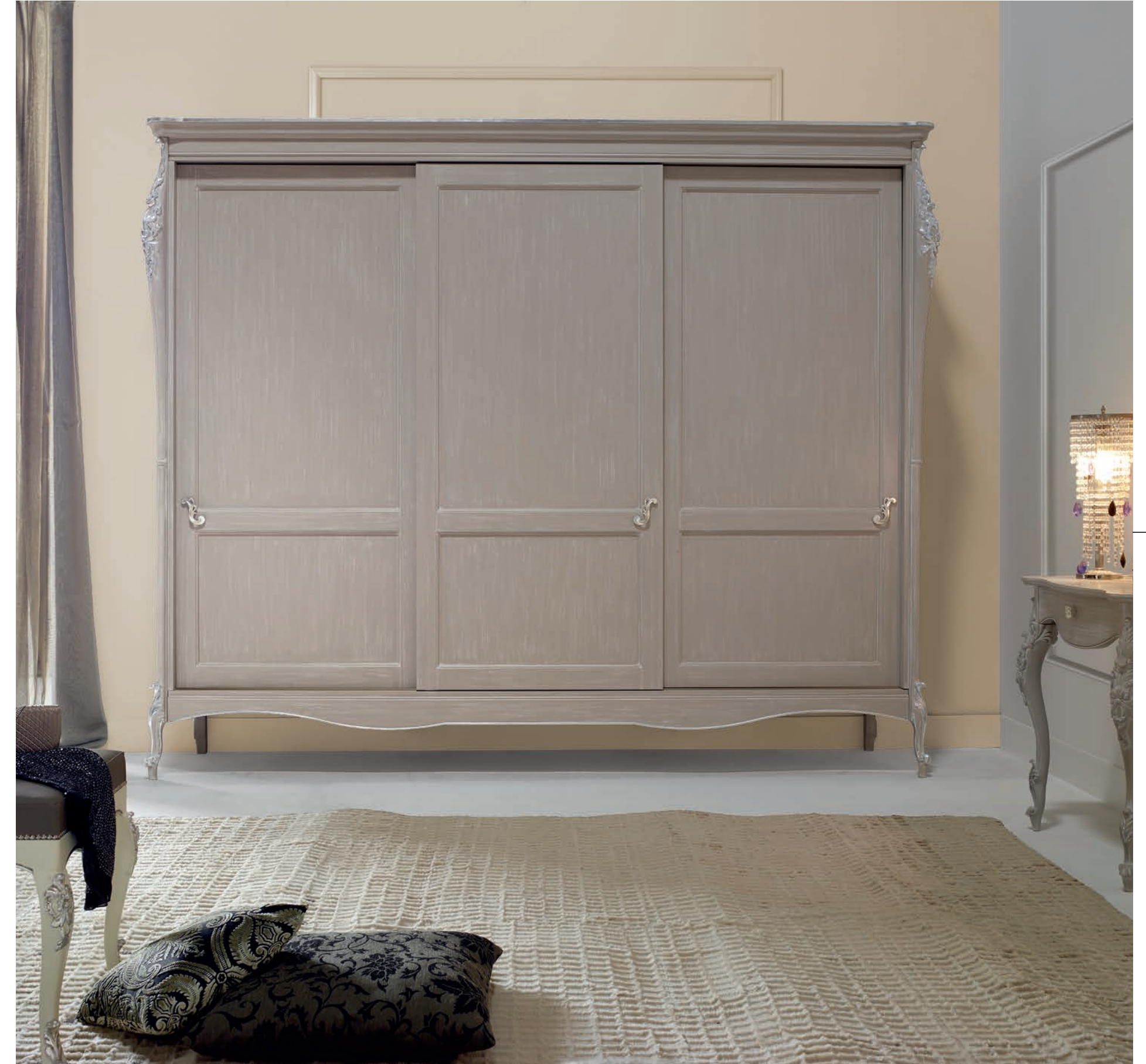
Art. 1030T Armadio tre Ante Scorrevoli / Wardrobe with three sliding doors L. 300 P. 69 H. 250