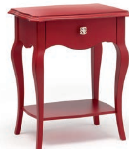
1752T Comodino / Night Table L. 56 P. 40 H. 67