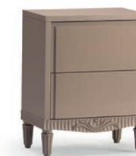
1229T Comodino due cassetti / Night table L. 55 P. 34 H. 70