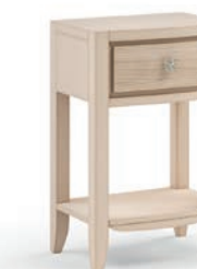
2033T Comodino / Night table Decoro Onda L. 44 P. 33,5 H. 67