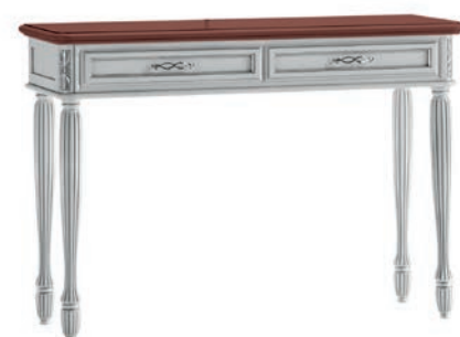
6006T Consolle toeletta / dressing table L. 120 P. 41 H. 83 Marco Polo Collection / pag. 107