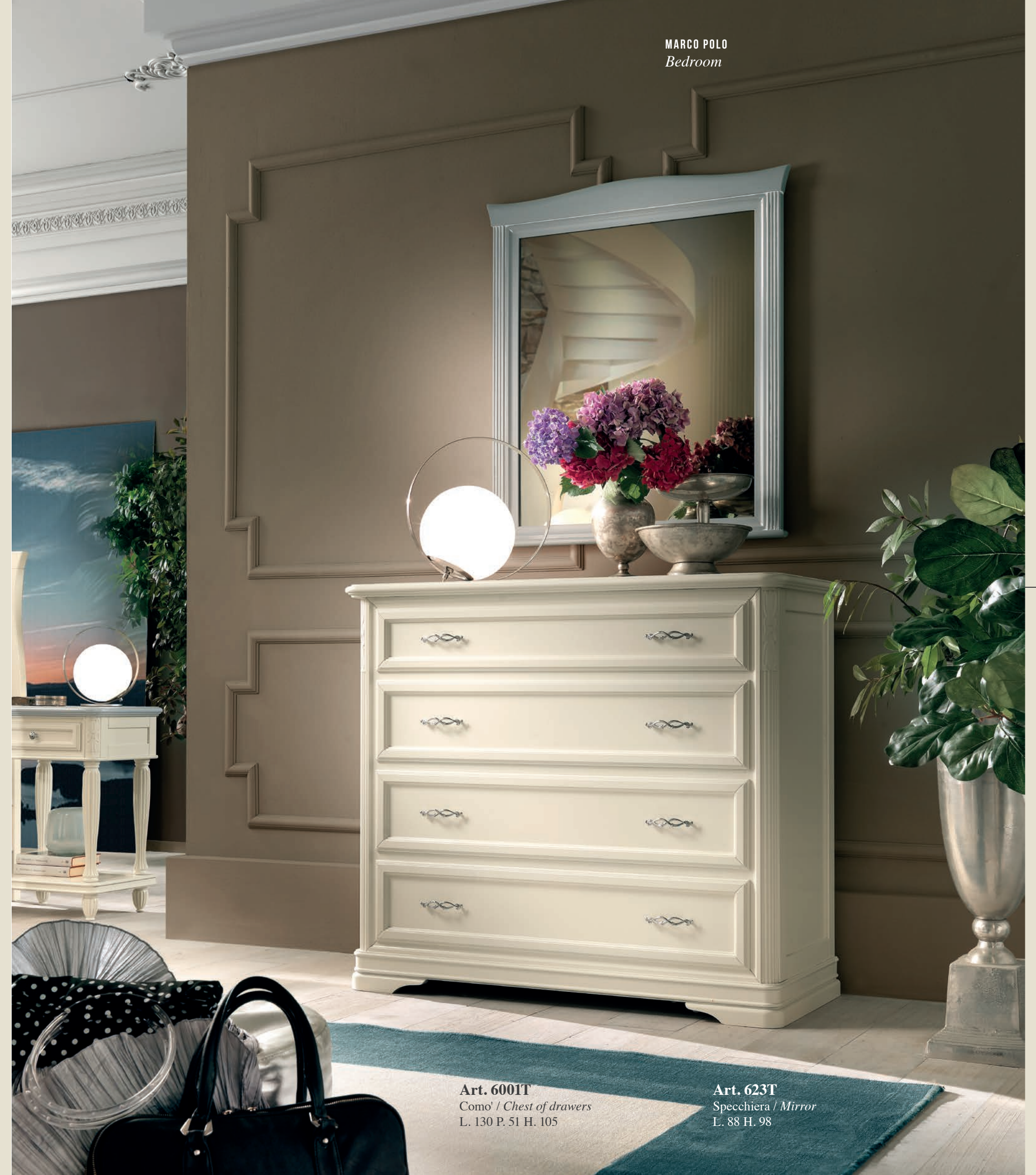
Art. 6001T Como' / Chest of drawers L. 130 P. 51 H. 105

Color balance: creamy white is combined with gray.