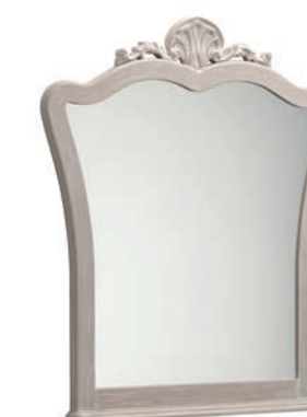
1015T Specchiera / Mirror L. 96 P. 6 H. 113