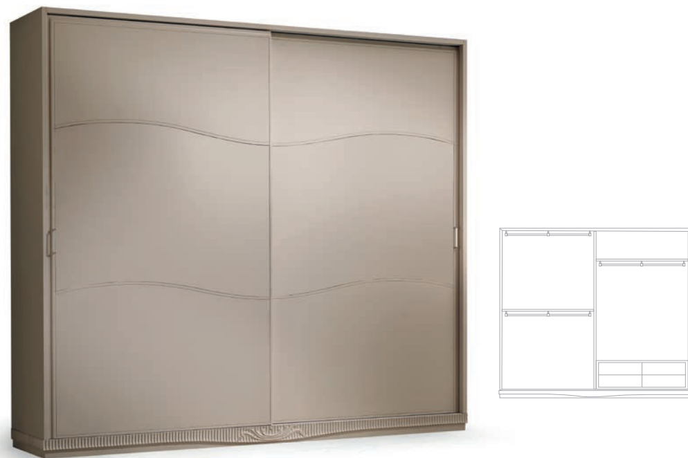
1230T Armadio ante scorrevoli / Wardrobe with sliding doors L. 281 P. 61 H. 249 Aria Collection / pag. 17