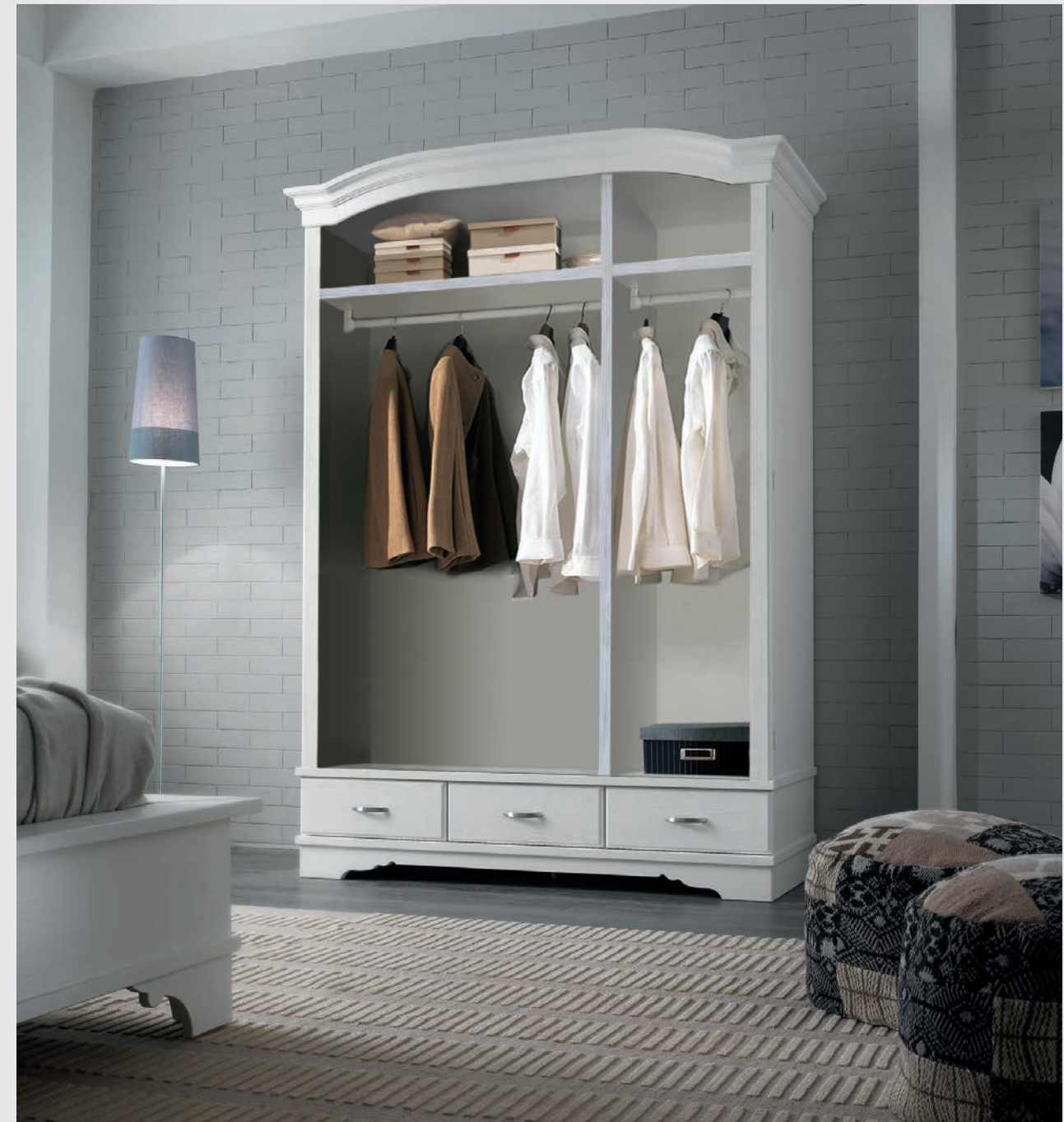
Art. 890T Armadio / Wardrobe L. 155 P. 56 H. 212