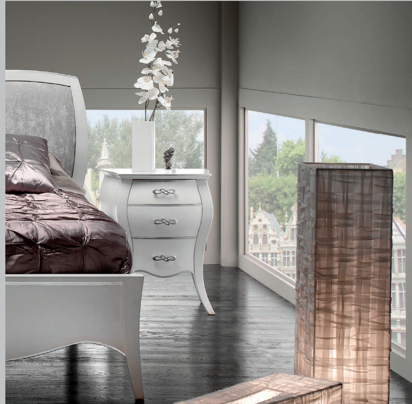
Art. 1768T Comodino / Night Table L. 55,5 P. 38 H. 69