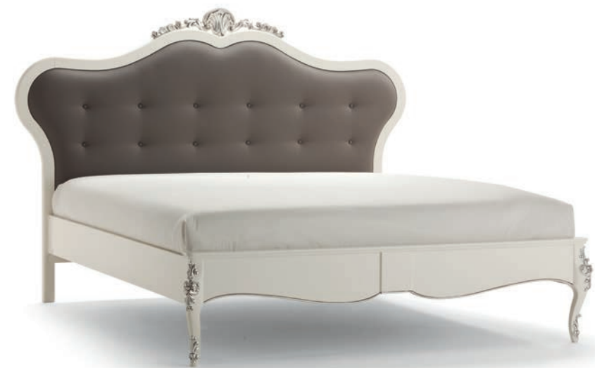
1031T Letto matrimoniale / King Sized Bed L. 221 P. 215 H. 151 Venere Collection / pag. 110