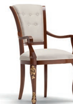
1005T Sedia Capotavola / Armchair L. 64 P. 62 H. 101 Venere Collection / pag. 140