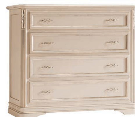
6001T Comò / Chest of drawers L. 130 P. 51 H. 105