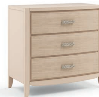
2048T Comò / Chest of drawers Decoro Onda L. 100 P. 53 H. 95