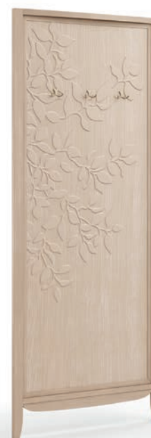
2016TF Pannello appendiabiti / Panel hanger Decoro Foglia L. 80 P. 5 H. 200