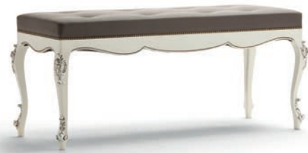
1034T Panchetta / Bench L. 130 P. 50 H. 55 Venere Collection / pag. 110