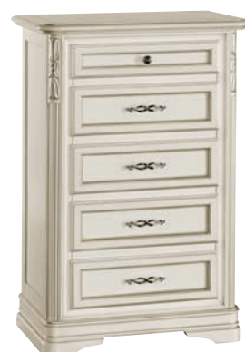
628T Cassettiera / Small chest of drawers L. 65 P. 42 H. 100 Marco Polo Collection / pag. 104