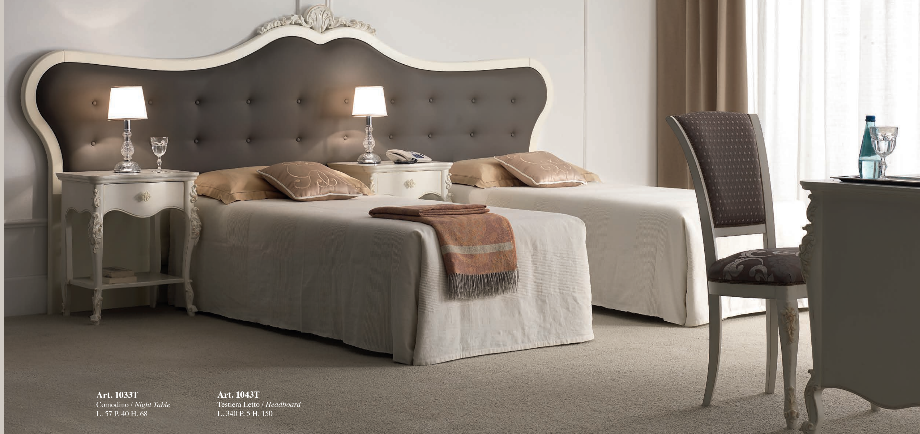
Art. 1033T Comodino / Night Table L. 57 P. 40 H. 68