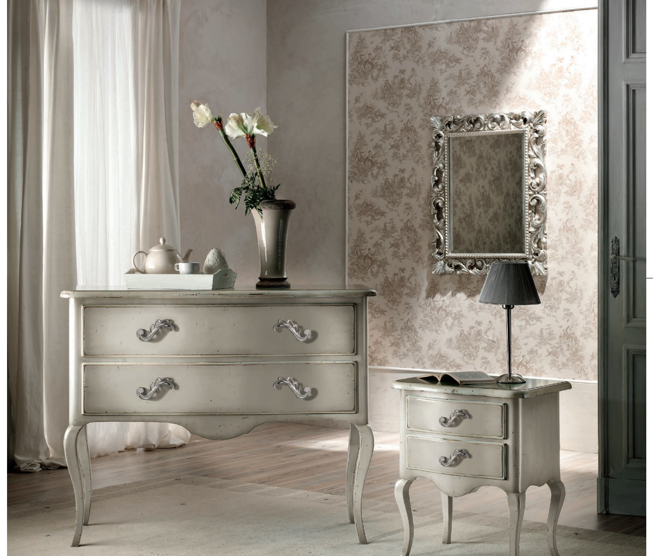
Art. 1750T Comò / Chest of Drawers L. 125 P. 52 H. 98