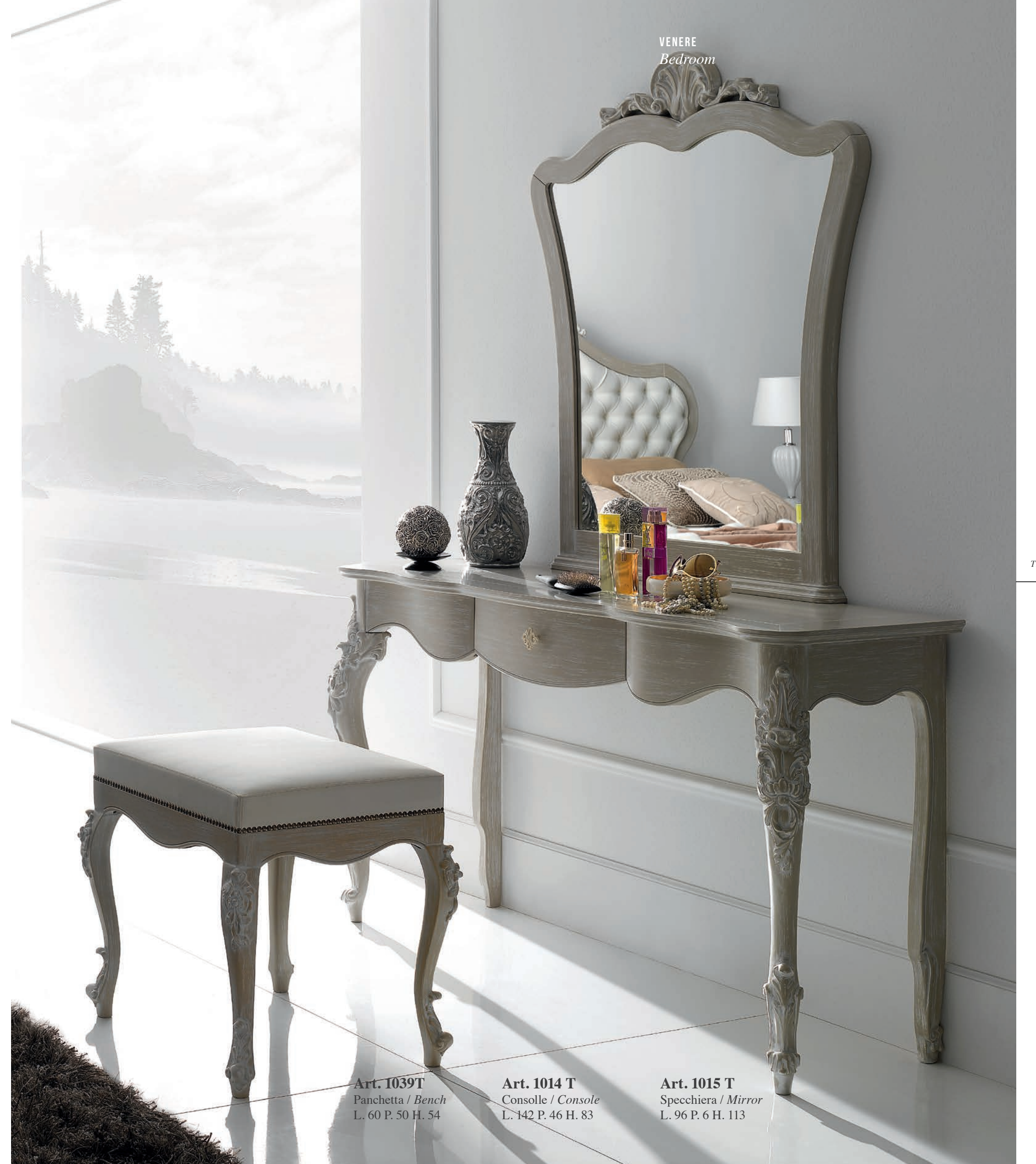
Art. 1039 T Panchetta / Bench L. 60 P. 50 H. 54

The elegance of the shapes, the richness of details, quilted padding of the headboard are the key features of the Venere bedroom. The special glossy white mink finish gives this furniture a timeless effect, between the scent of ancient and contemporary well-being.