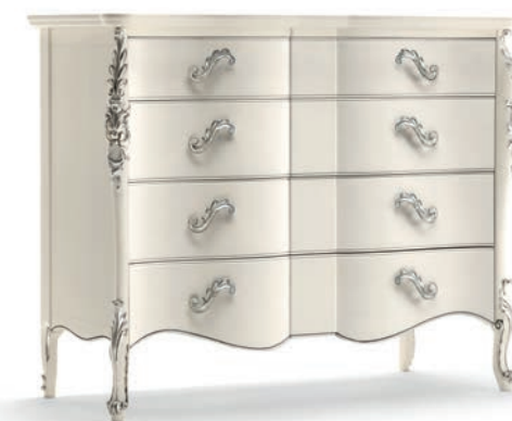
1032T Comò / Chest of Drawers L. 137 P. 57 H. 110