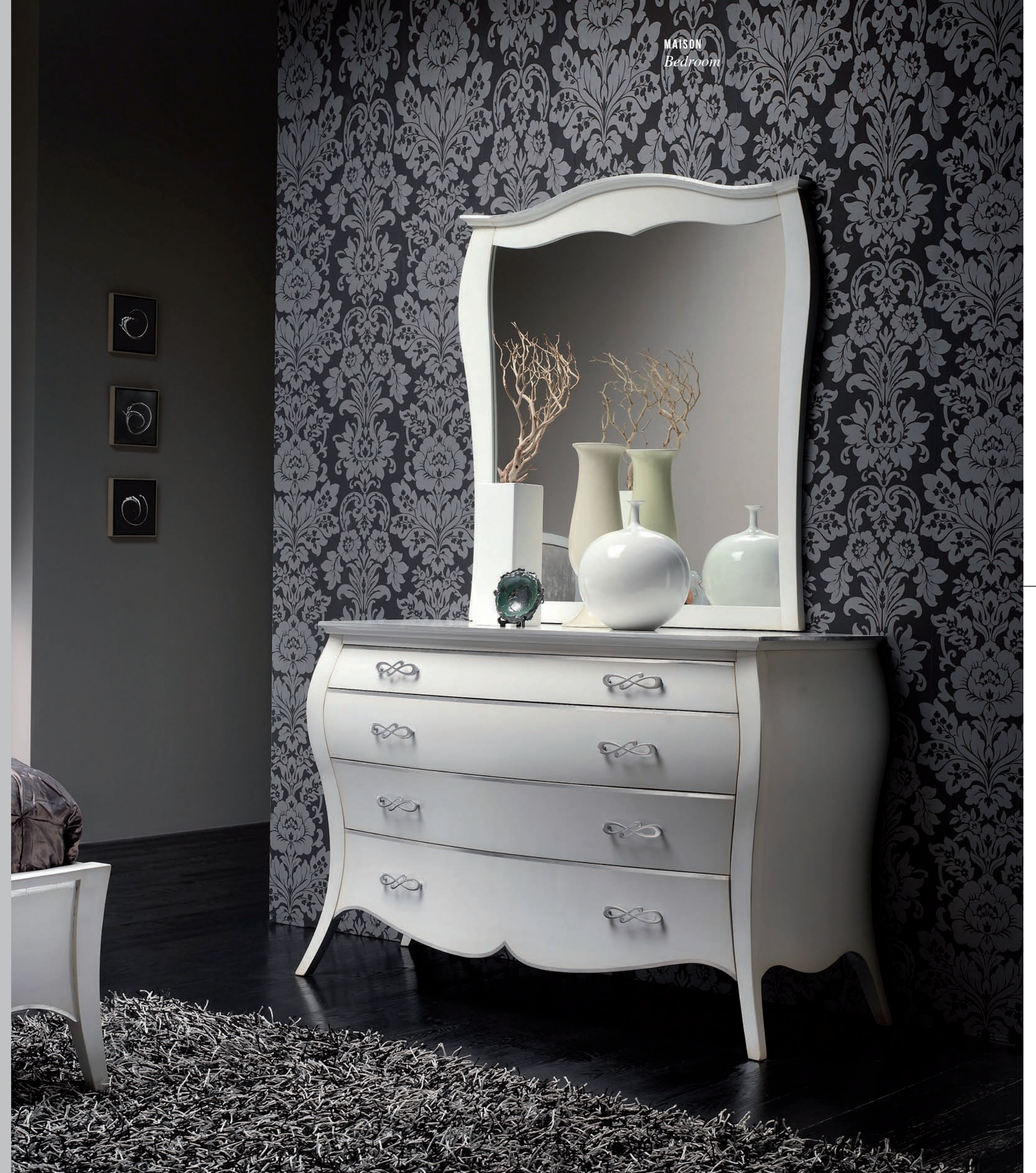
Art. 1769T Specchiera / Mirror L. 105 P. 10 H. 114