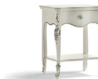
1033T Comodino / Night Table L. 57 P. 40 H. 68