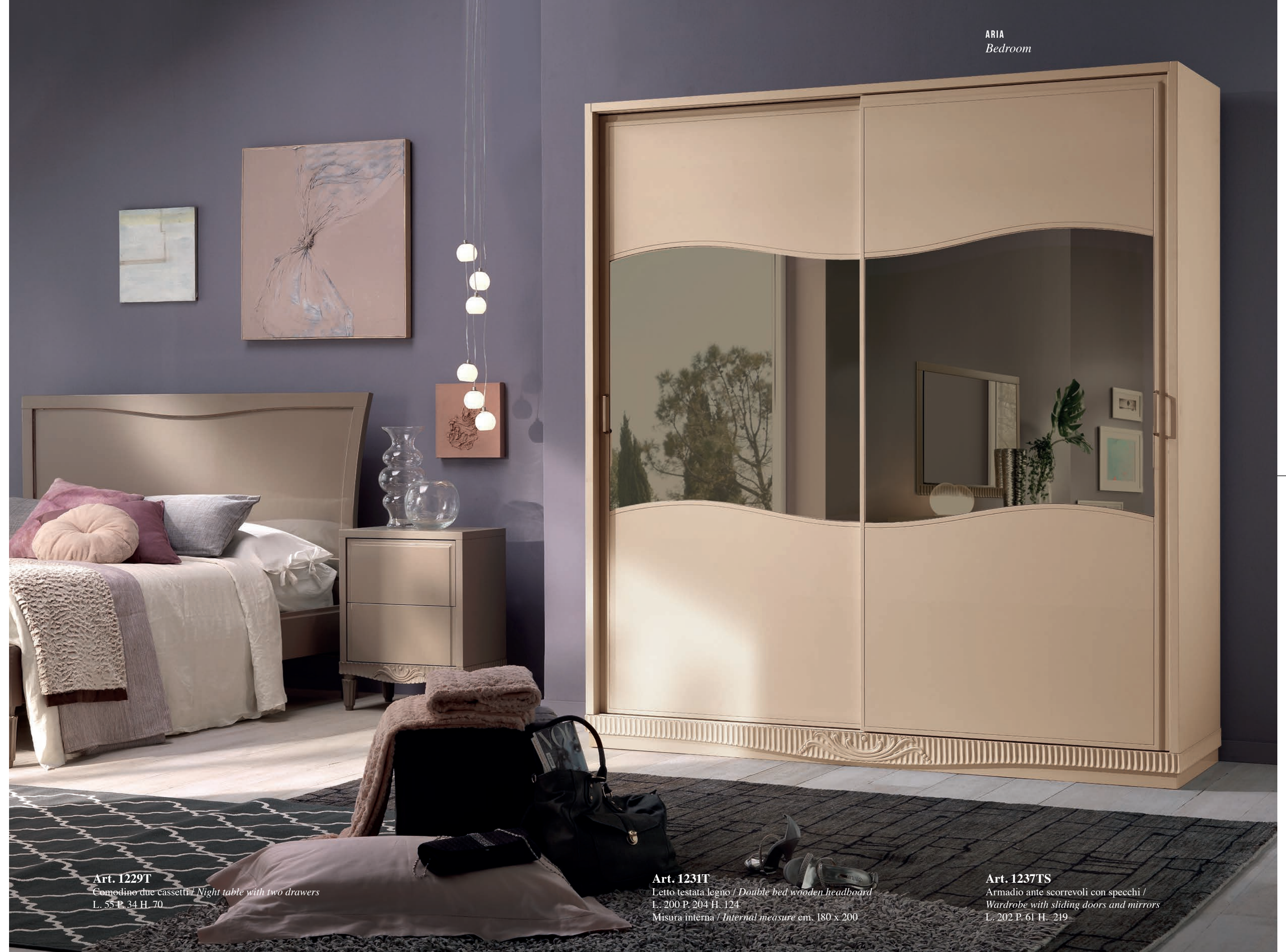
Art. 1229T Comodino due cassetti / Night table with two drawers L. 55 P. 34 H. 70

Two different sizes for the wardrobe it is the solution that satisfies the various needs of space, without neglecting the contemporary needs of contemporary living.