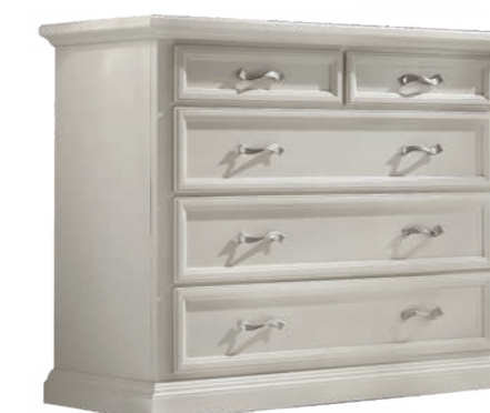
733T Comò / Chest of Drawers L. 126 P. 56 H. 102