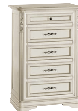
628T Cassettiera / Small chest of drawers L. 65 P. 42 H. 100 Marco Polo Collection / pag. 104