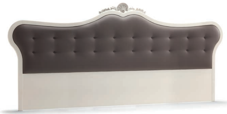
1043T Testiera letto / Headboard L. 340 P. 5 H. 150 Venere Collection / pag. 142