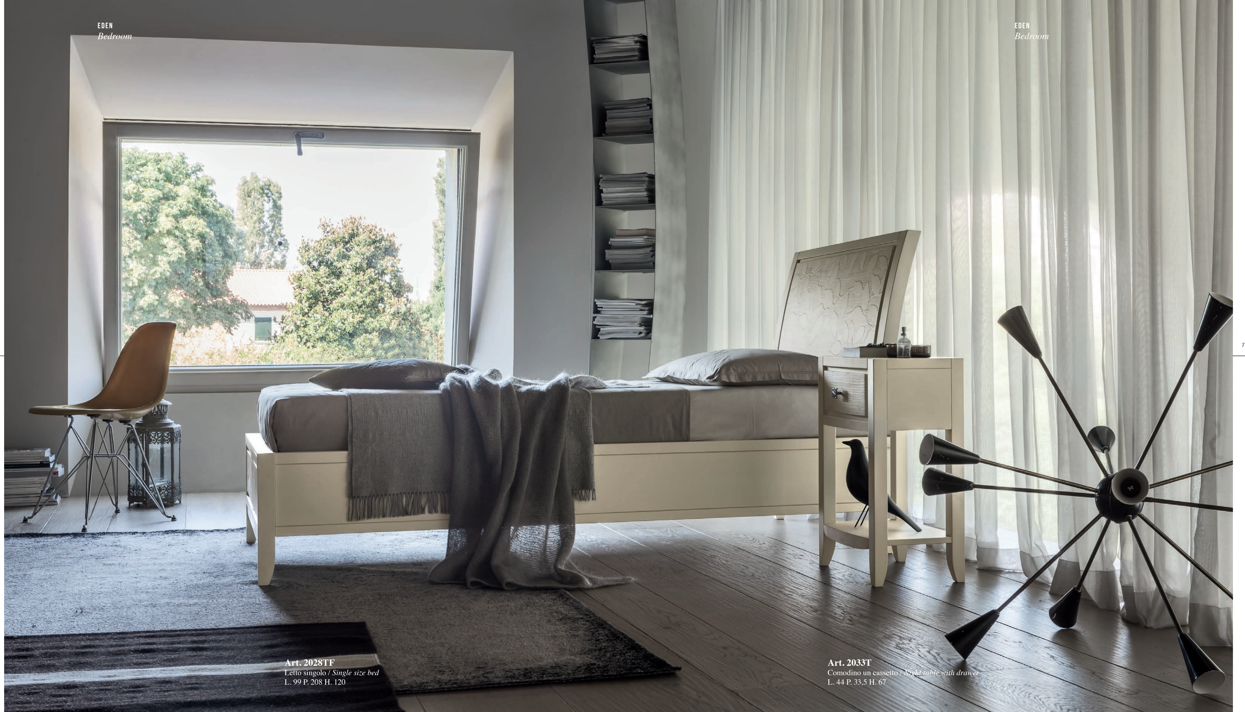
Art. 2028TF Letto singolo / Single size bed L. 99 P. 208 H. 120