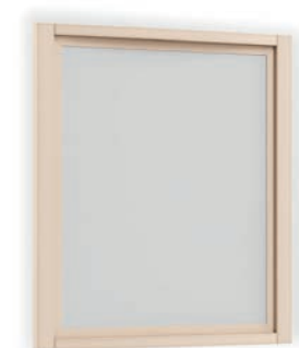
2015T Specchiera / Mirror L. 80 P. 5 H. 90 Eden Collection