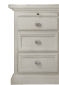
732T Comodino / Night Table L. 52 P. 38 H. 70