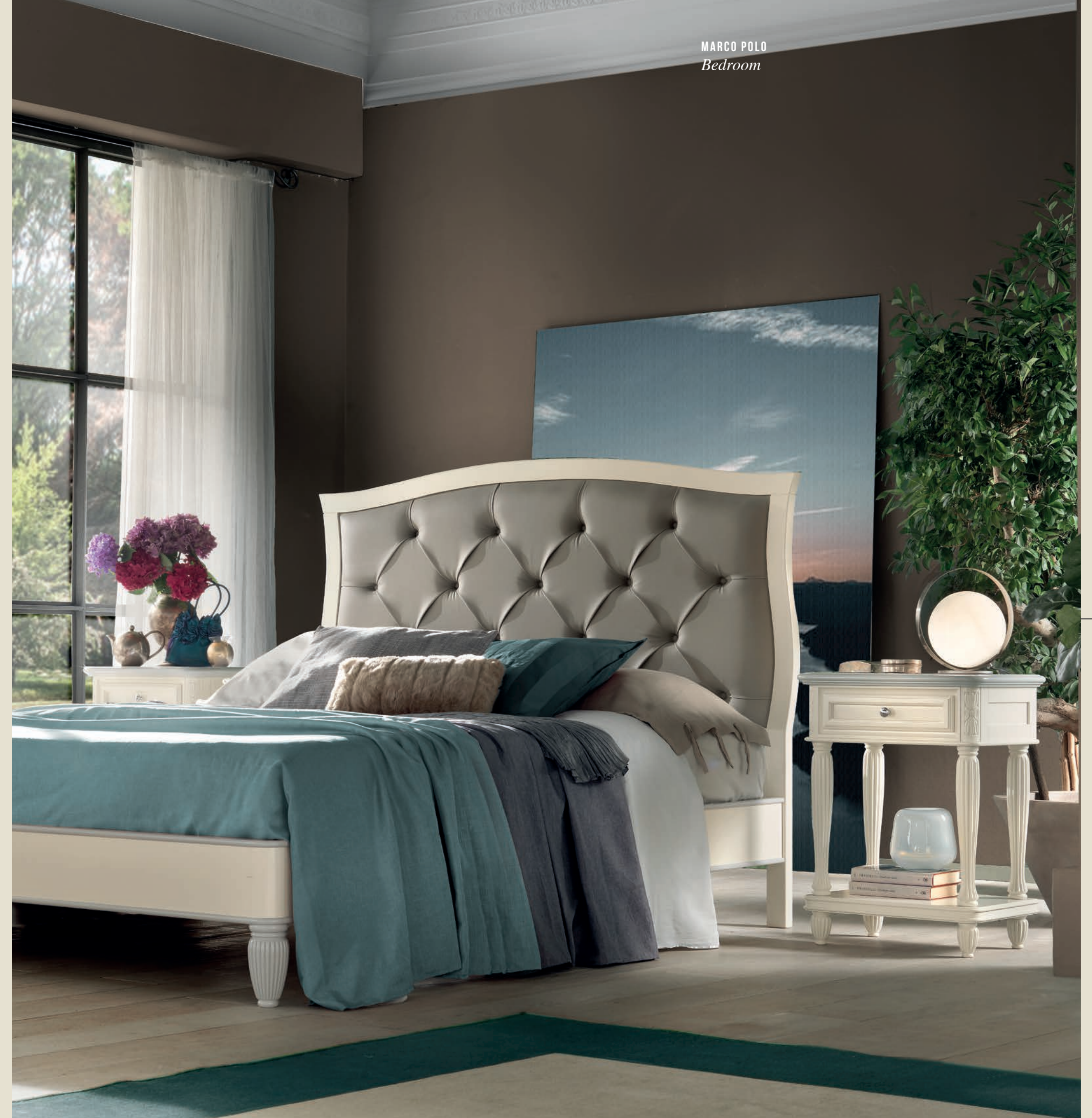
Art. 6080T Letto matrimoniale / Double bed L. 177 P. 208 H. 135 Misure interne / Internal measures cm. 160 x 200

Discreet elegance and harmonious proportions.