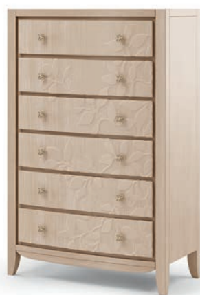
2036TF Cassettiera / Chest of drawers Decoro Foglia L. 85 P. 42 H. 130 Eden Collection / pag. 27