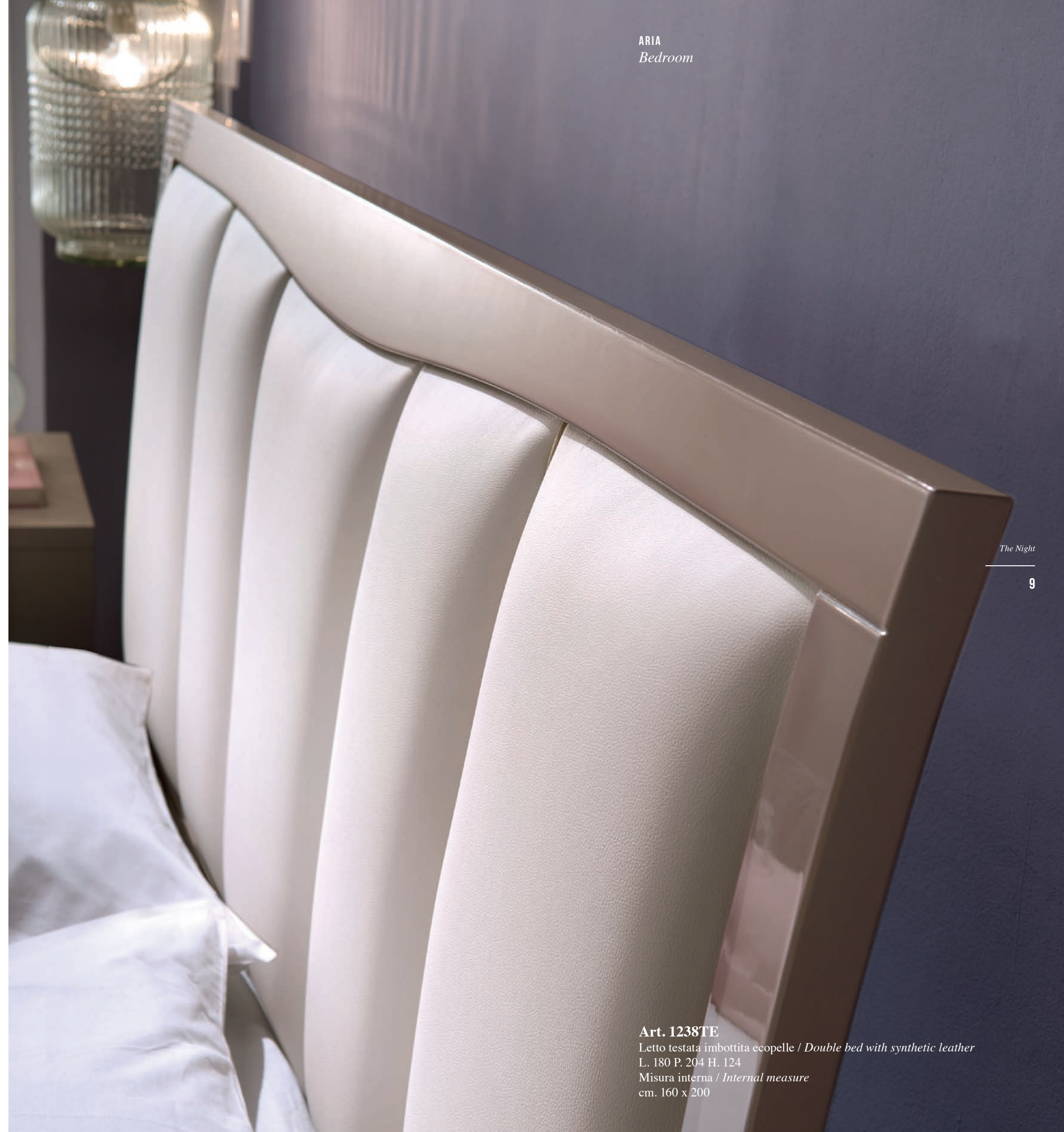
Art. 1238TE Letto testata imbottita ecopelle / Double bed with synthetic leather L. 180 P. 204 H. 124 Misura interna / Internal measure cm. 160 x 200