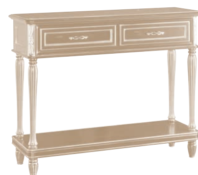
629T Consolle / Console L. 120 P. 40 H. 98 Marco Polo Collection