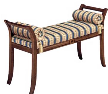
538T Panchetta / Bench L. 113 P. 42 H. 64 Maison Collection