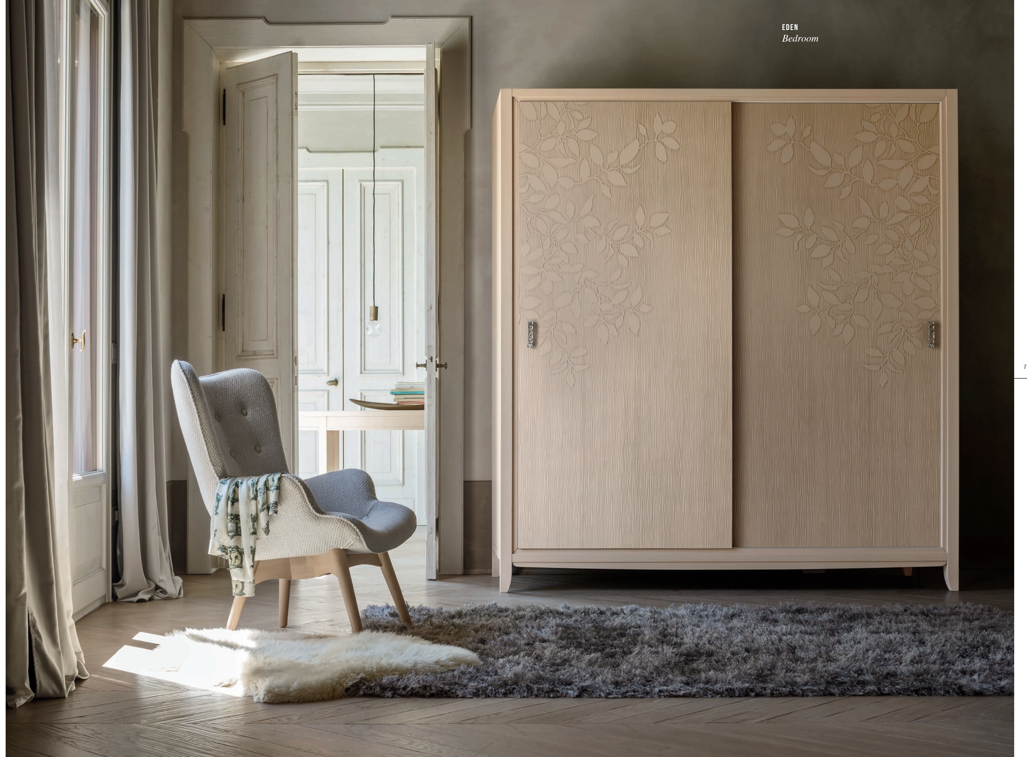
Art. 2037TF Armadio due ante scorrevoli / Two sliding doors wardrobe L. 200 P. 64 H. 220