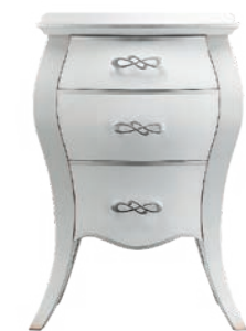
1768T Comodino / Night Table L. 55,5 P. 38 H. 69