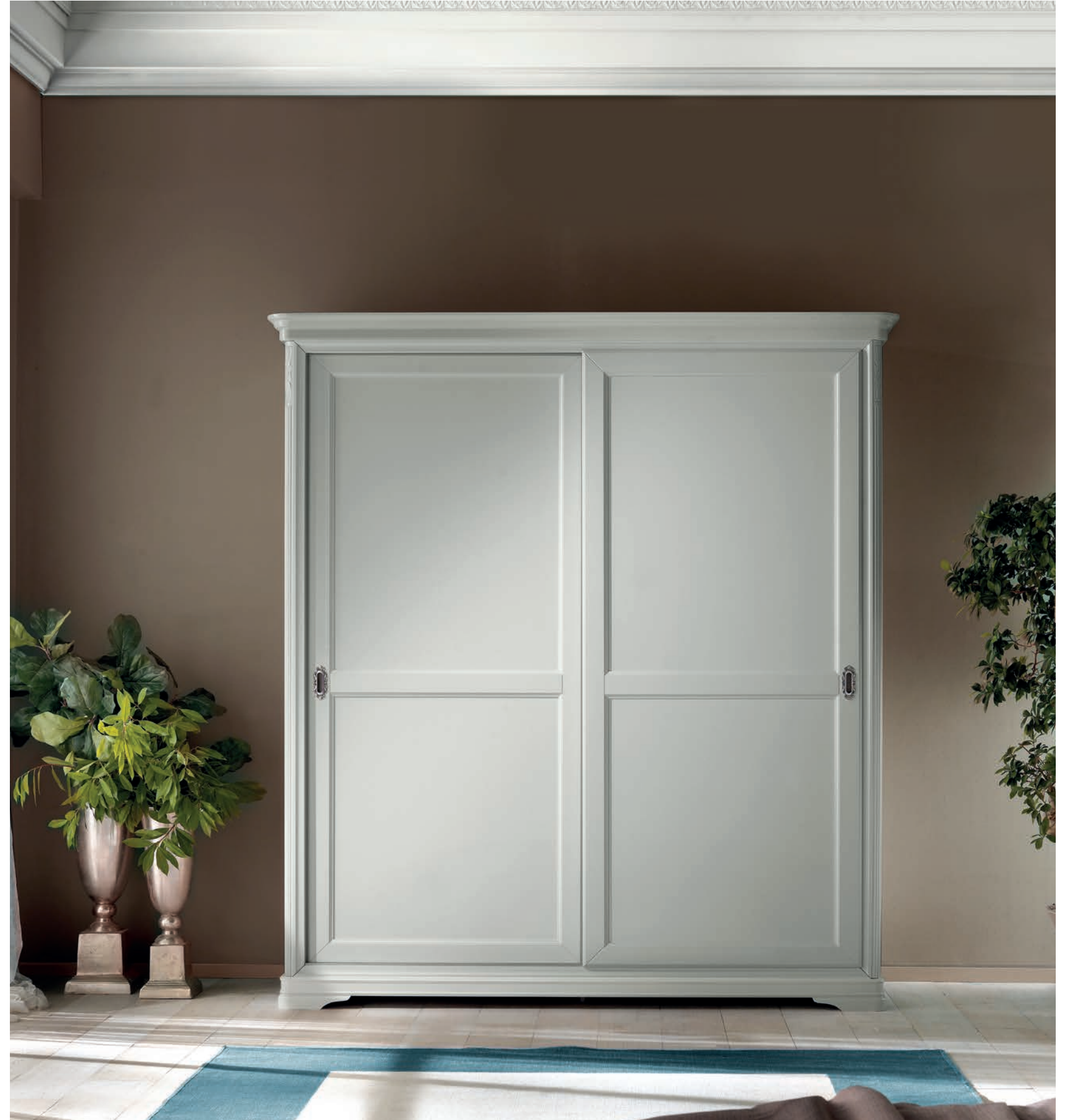
Art. 6004T Armadio / Wardrobe L. 200 P. 67 H. 220