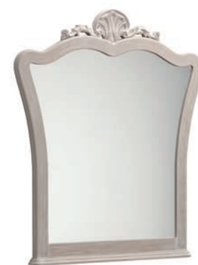
1015T Specchiera / Mirror L. 96 P. 6 H. 113 Venere Collection / pag. 123