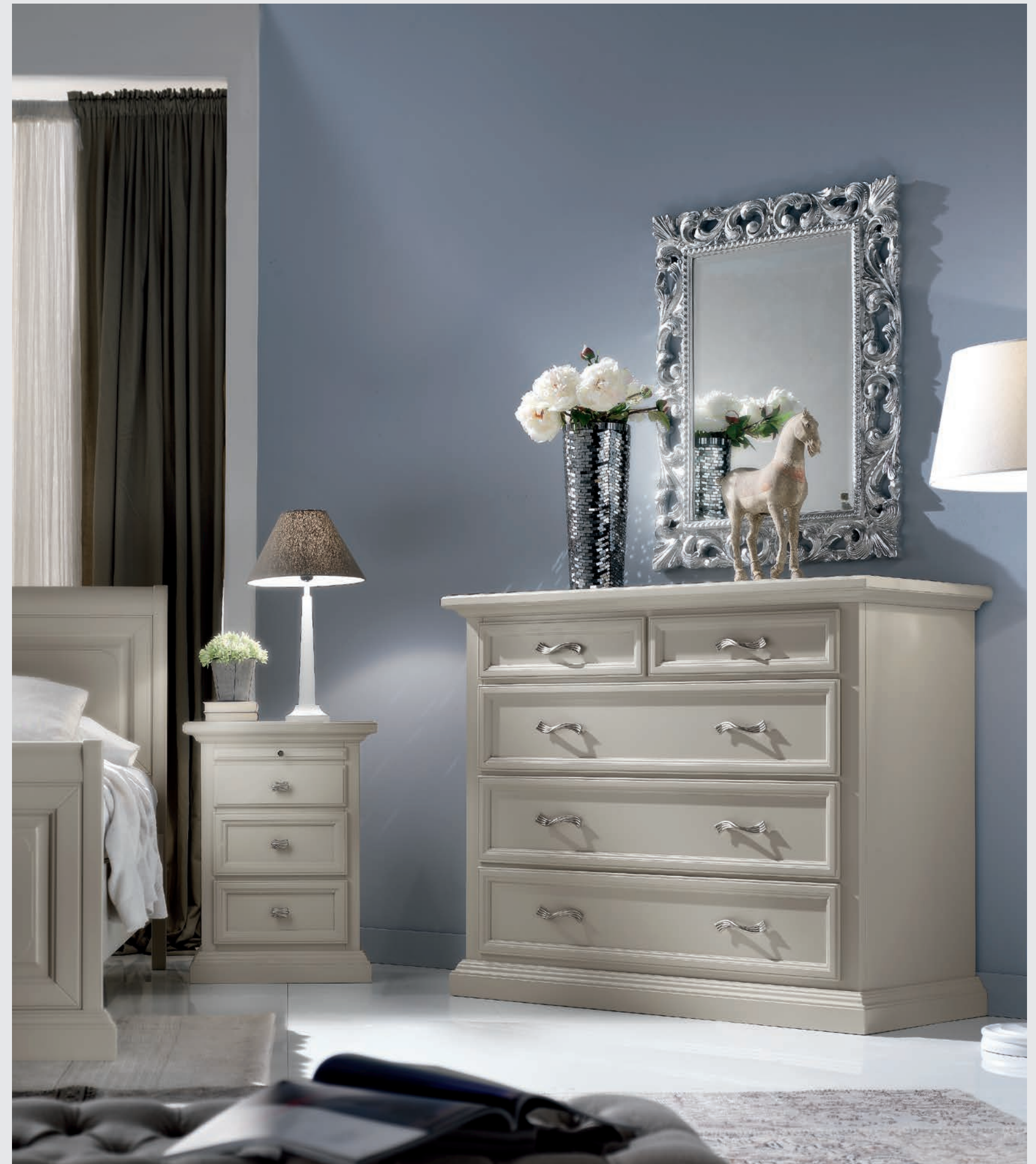
Art. 732T Comodino / Night Table L. 52 P. 38 H. 70