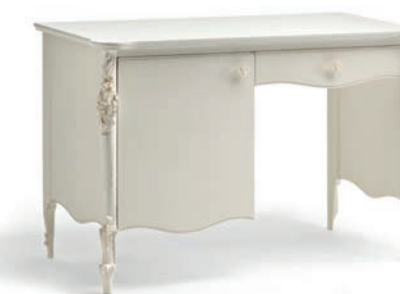
1041T Scrivitoio da camera / Bedroom Desk L. 125 P. 61 H. 82 Venere Collection / pag. 145