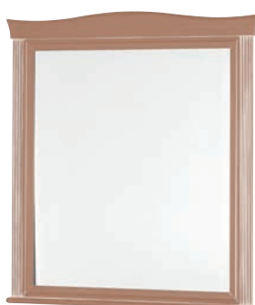
623T Specchiera / Mirror L. 88 H. 98 Marco Polo Collection / pag. 107