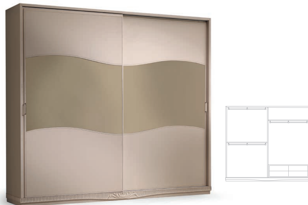
1230TS Armadio ante scorrevoli con specchi / Wardrobe with sliding doors and mirrors L. 281 P. 61 H. 249 Aria Collection / pag. 15