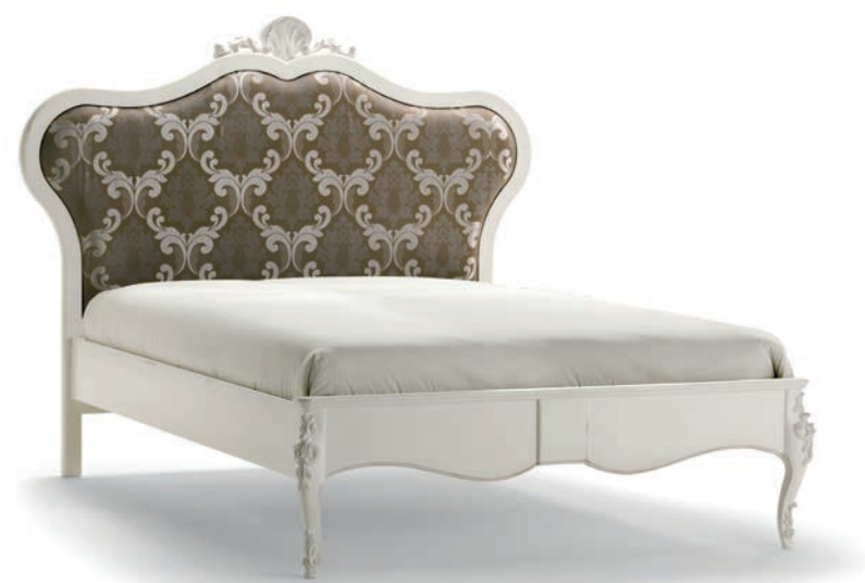
1040T Letto una piazza e mezza / French Sized Double Bed L. 181 P. 215 H. 149 Misura interna / Bed frame cm. 140 x 200