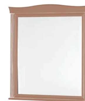
623T Specchiera / Mirror L. 88 H. 98