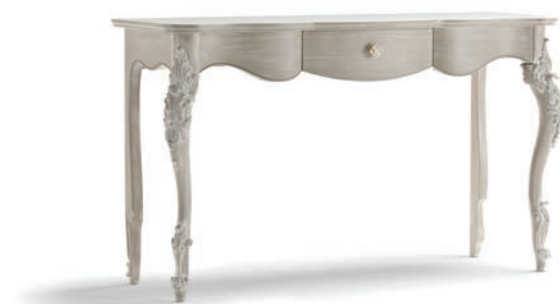
1014T Consolle / Console L. 142 P. 46 H. 83 Venere Collection / pag. 123