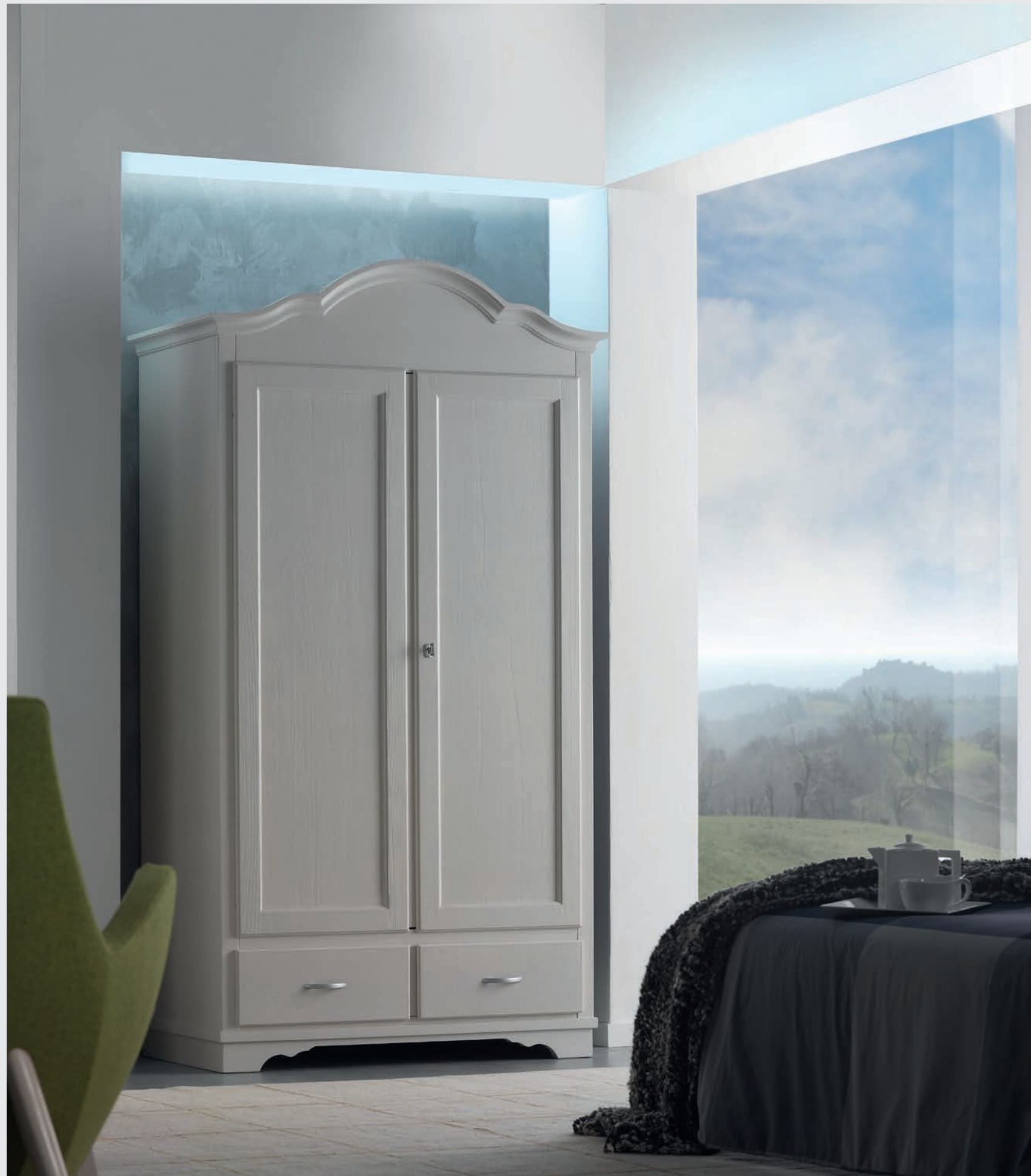
Art. 837T Armadio / Wardrobe L. 118 P. 65 H. 218