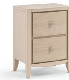
2029T Comodino / Night table Decoro Onda L. 50 P. 37 H. 67