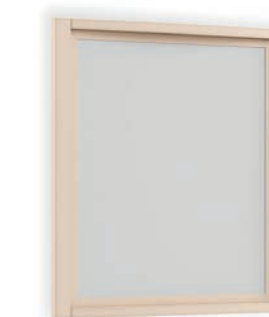
2015T Specchiera / Mirror L. 80 P. 5 H. 90