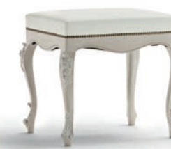
1039T Panchetta / Bench L. 60 P. 50 H. 54 Venere Collection / pag. 121