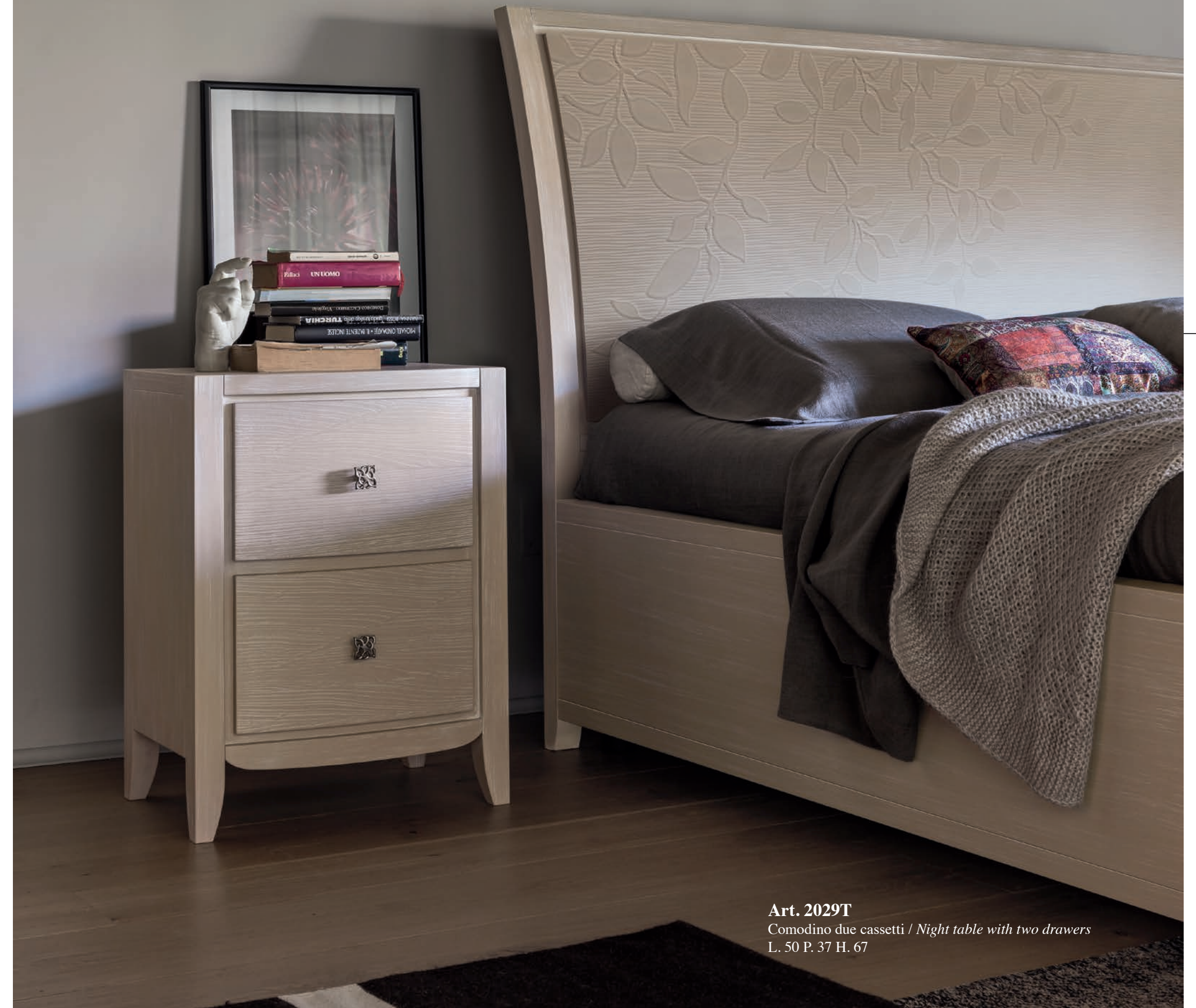
Art. 2029T Comodino due cassetti / Night table with two drawers L. 50 P. 37 H. 67