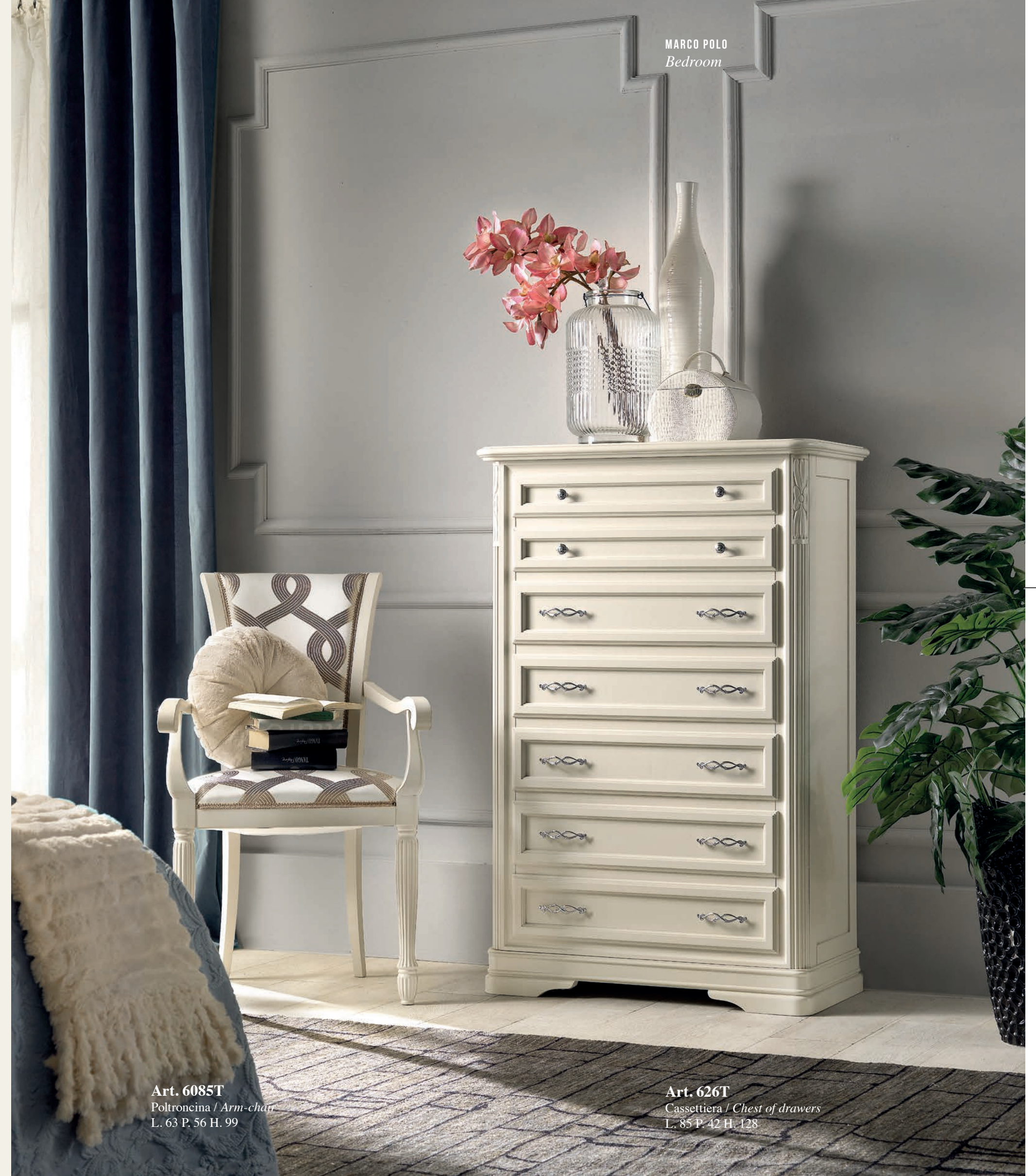
Art. 6085T Poltroncina / Arm-chair L. 63 P. 56 H. 99