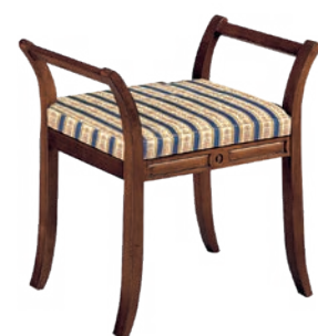
537T Panchetta / Bench L. 116 P. 38 H. 77 Maison Collection