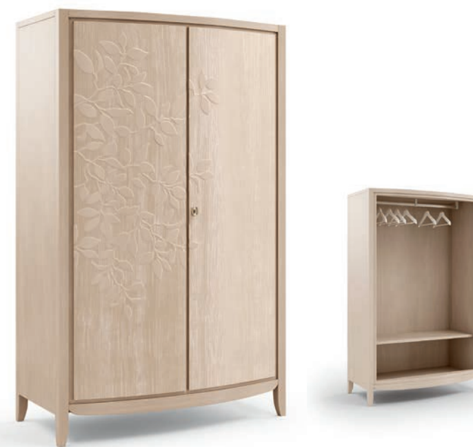
2042TF Armadietto / Small wardrobe Decoro Foglia L. 125 P. 60 H. 200 Eden Collection / pag. 51