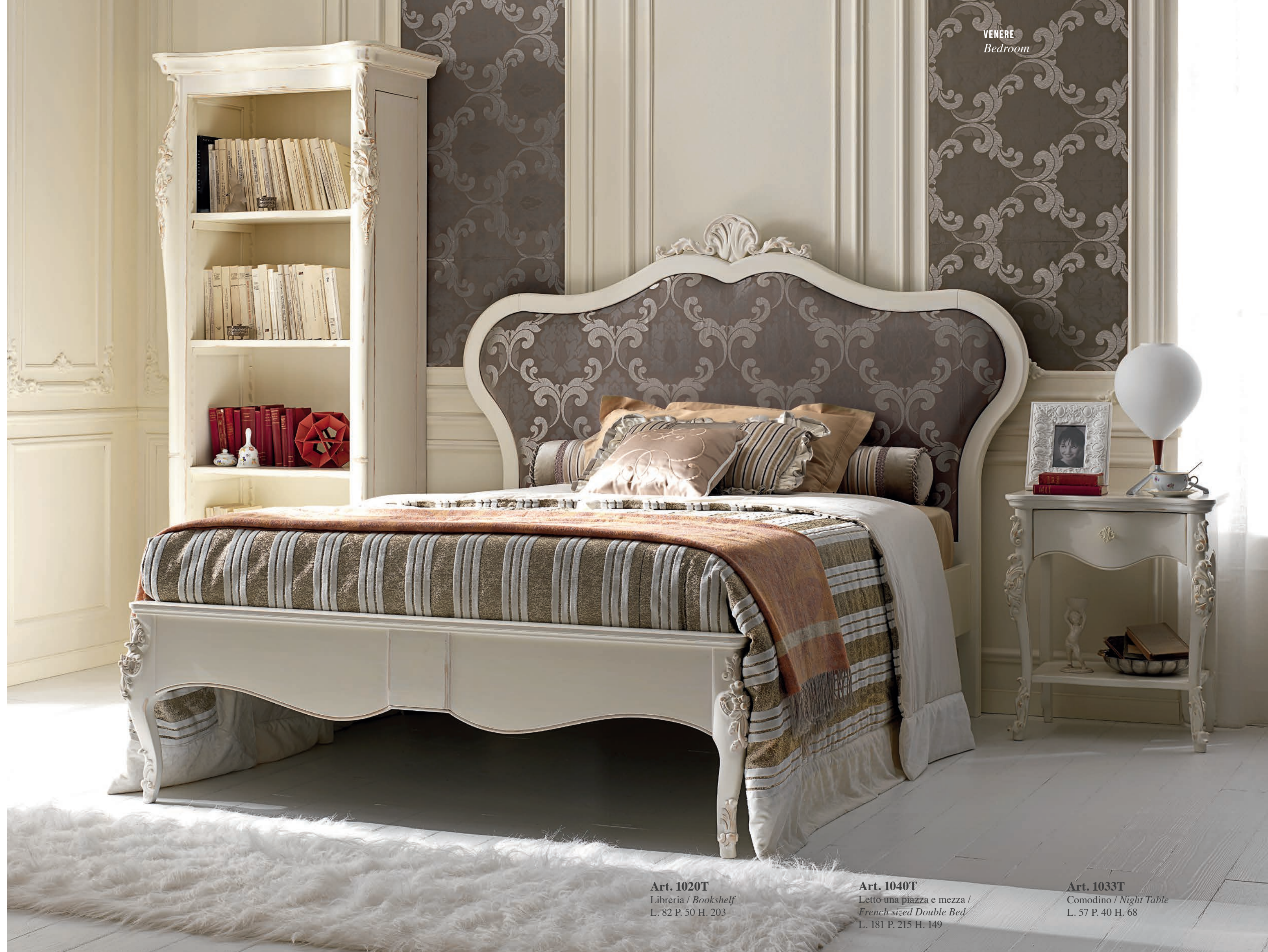
Art. 1020T Libreria / Bookshelf L. 82 P. 50 H. 203

Upholstered headboard and decapè finish define a style of furniture that recalls the ancient with understated elegance, in a warm and relaxing atmosphere that makes you feel protected in a tender embrace. The French sized double bed, is more comfortable for a adult or teenager compared to a single bed, and less demanding than a normal double bed.