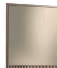
1215T Specchiera / Mirror L. 80 H. 80