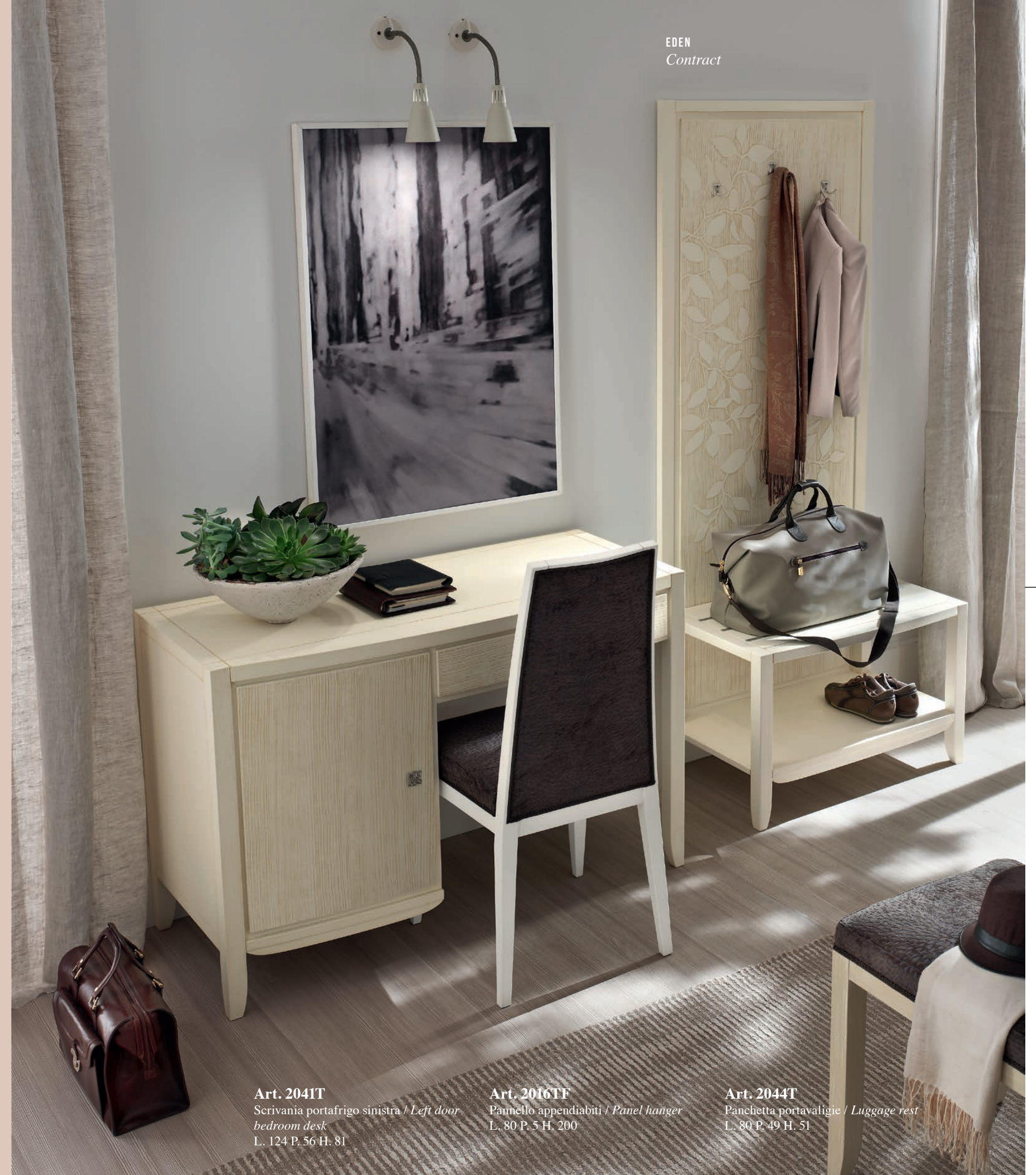
Art. 2041T Scrivanía portafriego sinistra / Left door bedroom desk L. 124 P. 56 H. 81