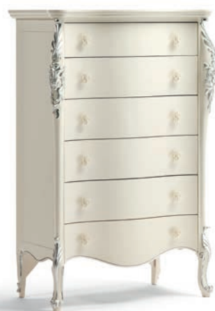
1036T Cassettiera / Chest of Drawers L. 86 P. 47 H. 132 Venere Collection / pag. 115