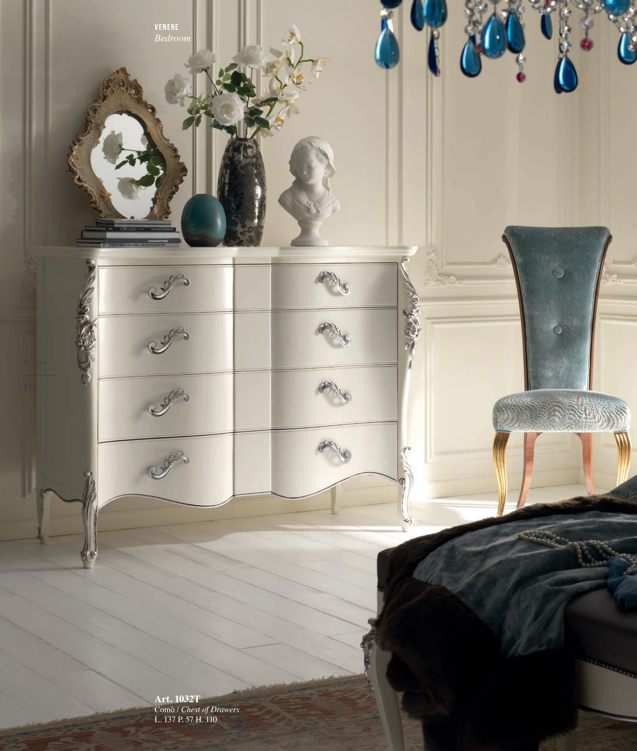
Art. 1032T Comò / Chest of Drawers L. 137 P. 57 H. 110