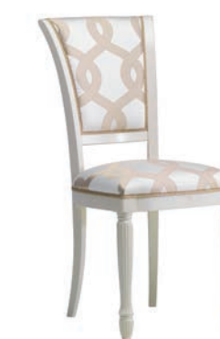
6084T Sedia / Chair L. 47 P. 56 H. 99 Marco Polo Collection / pag. 107