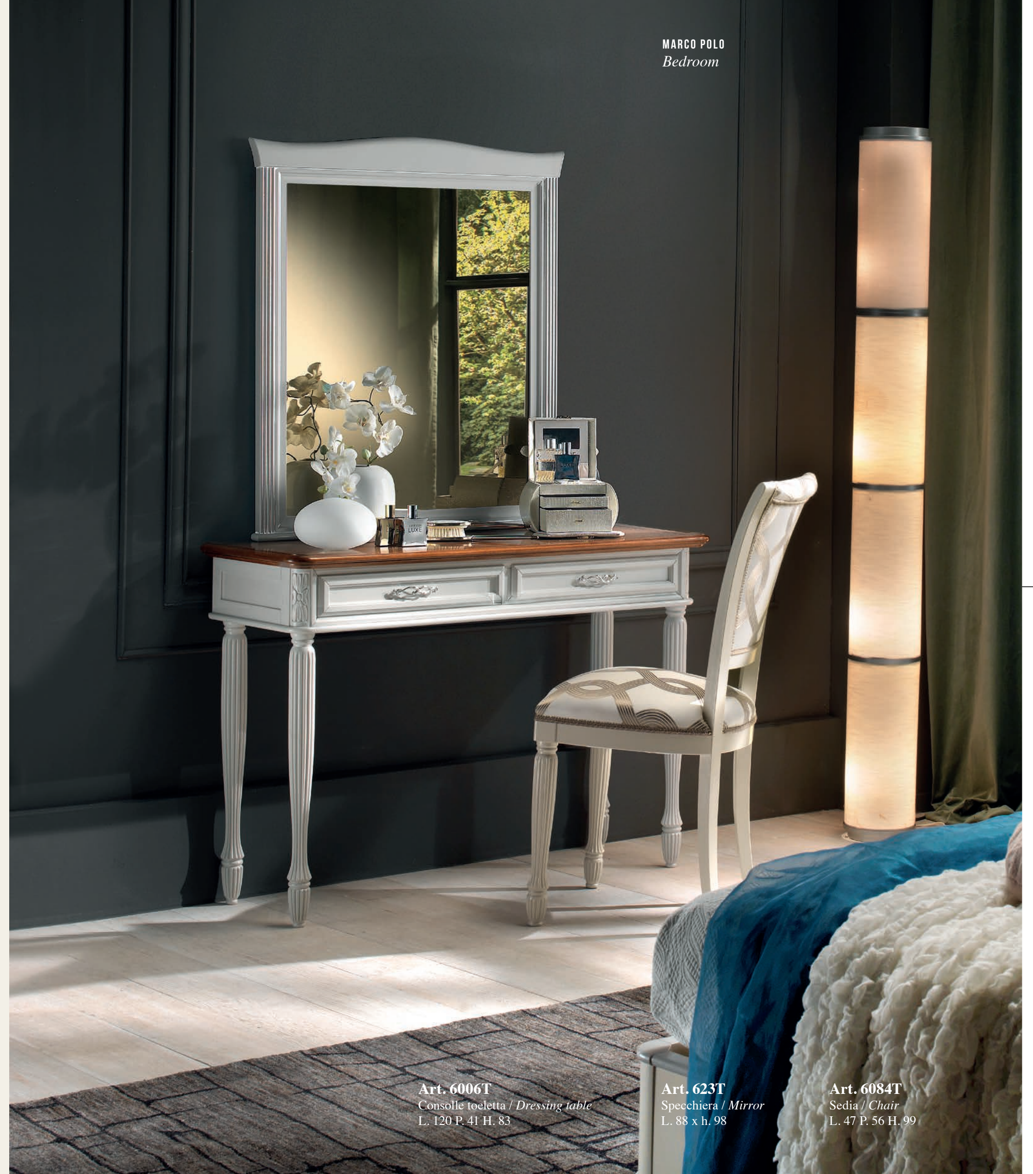
Art. 6006T Consolle toeletta / Dressing table L. 120 P. 41 H. 83