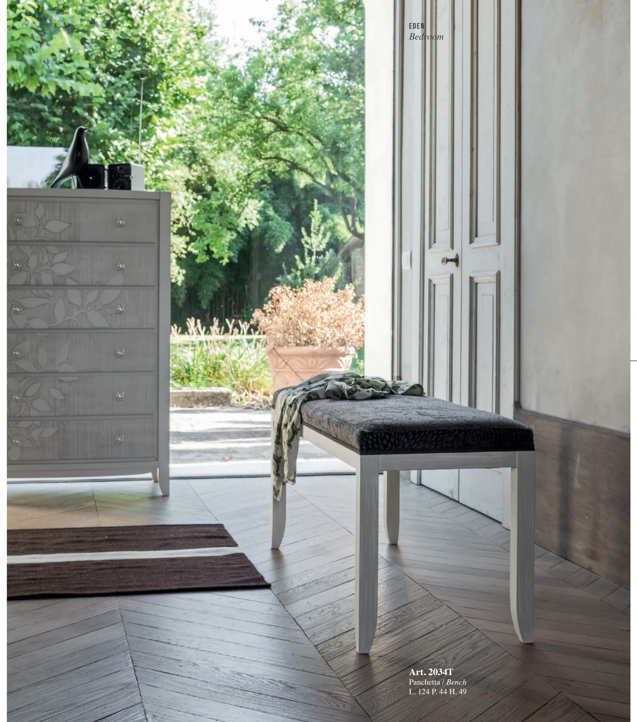
Art. 2034T Panchetta / Bench L. 124 P. 44 H. 49

The upholstered bench is a furnishing element that adds a sense of sophistication to the bedroom. A detail with a touch of class.