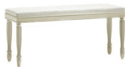
6005T Panchetta / Bench L. 116 P. 40 H. 51 Marco Polo Collection / pag. 86