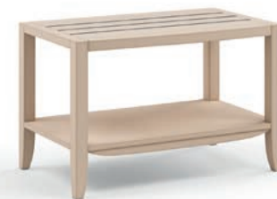
2044T Panchetta portavaligia / Luggage rest L. 80 P. 49 H. 51