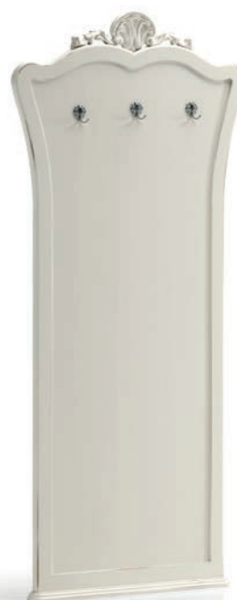
Art. 1016T Pannello da ingresso / Clothes Hanger Panel L. 96 P. 6 H. 207 Venere Collection / pag. 144