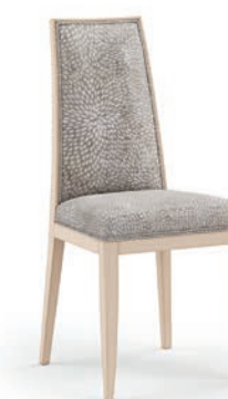
2004T Sedia / Chair L. 48 P. 54 H. 104