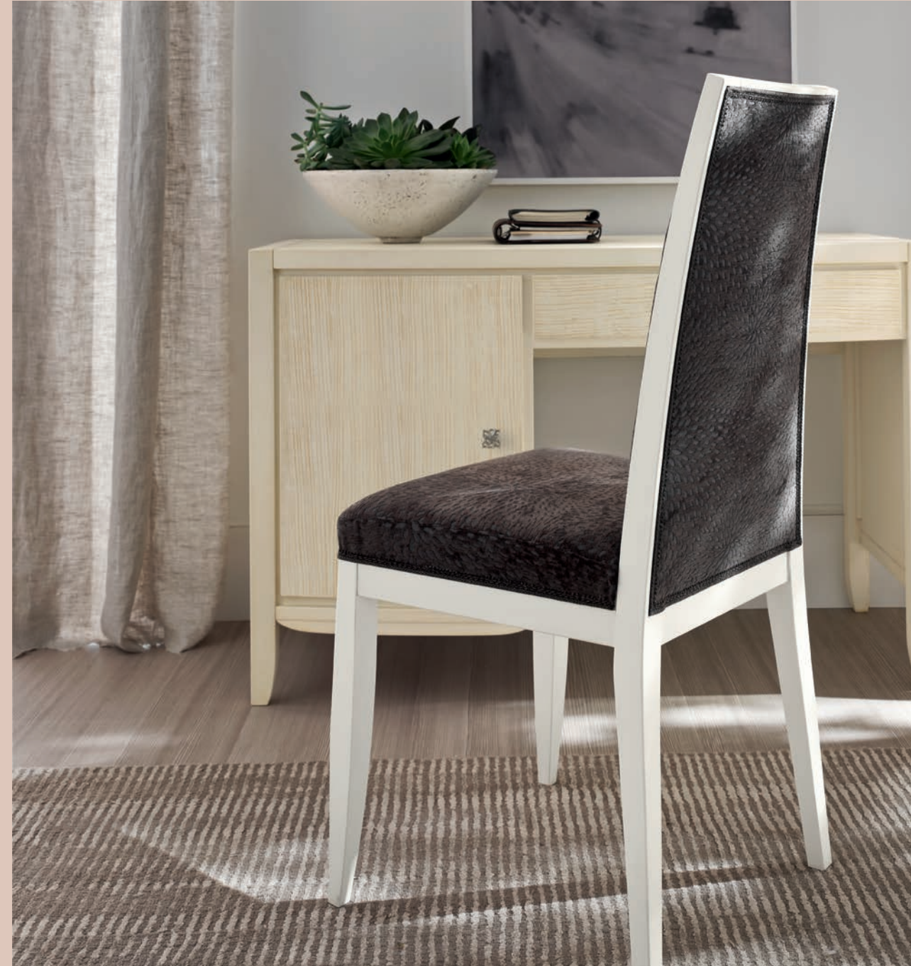
Art. 2004T Sedia / Chair L. 48 P. 54 H. 104