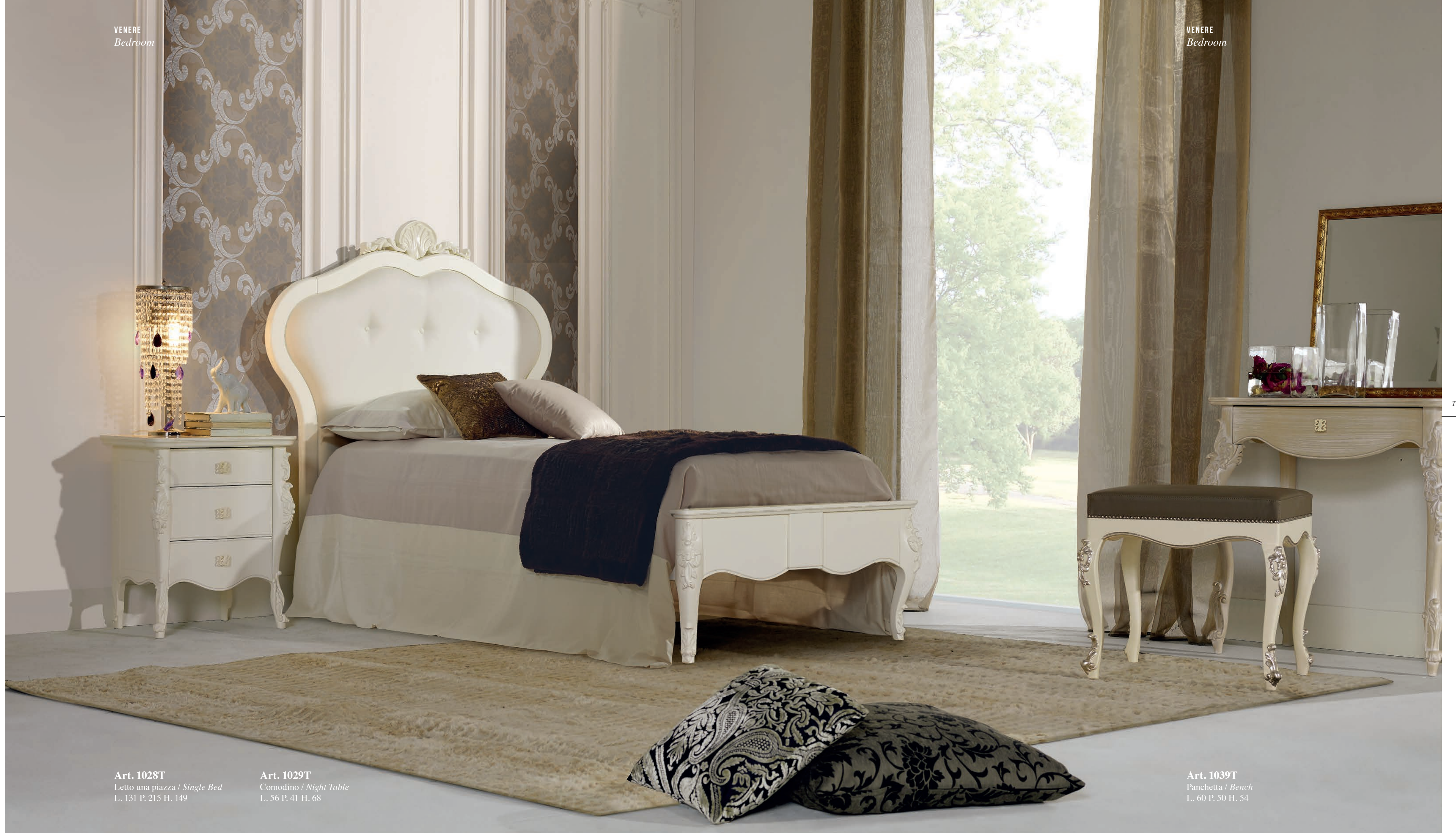
Art. 1039T Panchetta / Bench L. 60 P. 50 H. 54