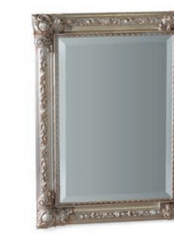
1024T Specchiera / Mirror L. 60 P. 7 H. 80