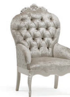
1065T Poltroncina / Arm-chair L. 65 P. 69 H. 104 Venere Collection / pag. 118