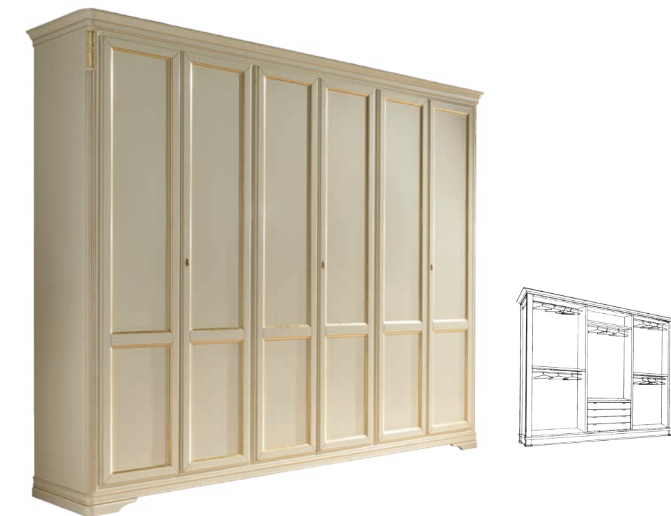
625T Armadio / Wardrobe L. 310 P. 67 H. 250 Maison Collection / pag. 82