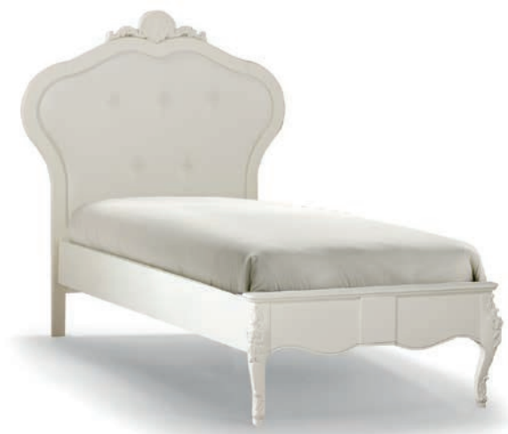
1028T Letto una piazza / Single Bed L. 131 P. 215 H. 149 Misura interna / Bed frame cm. 90 x 200