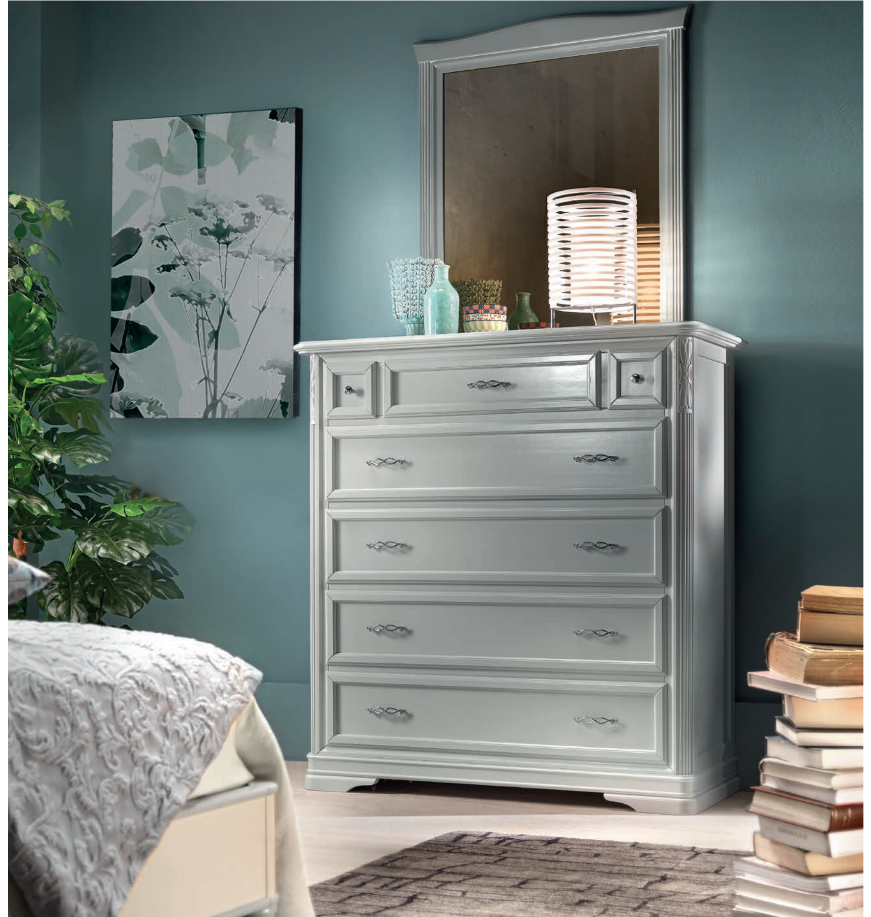
Art. 621T Comò con ribalta / Chest of drawers L. 120 P. 51 H. 130