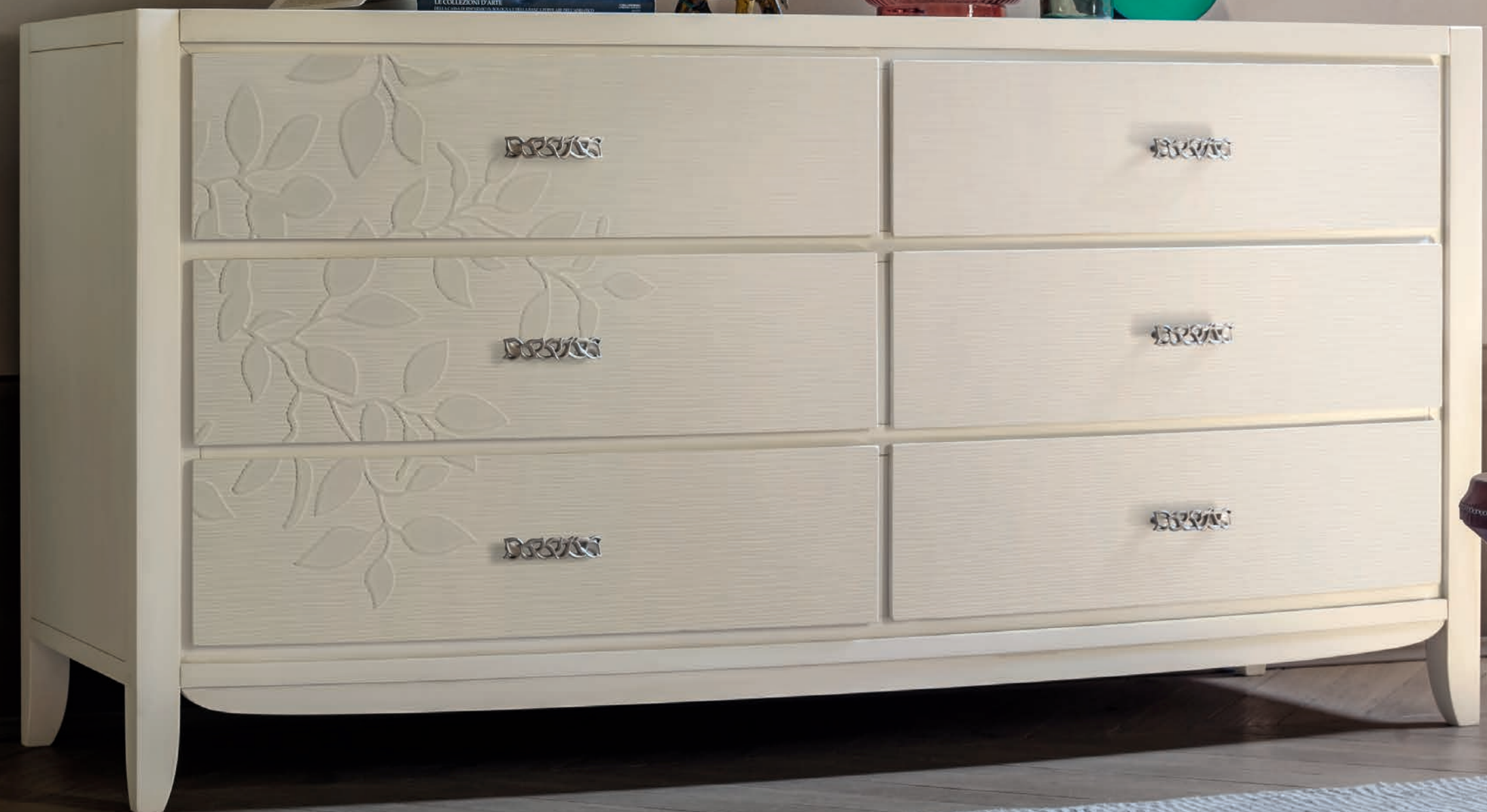
Art. 2049TF Comò sei cassetti / Chest of drawers L. 180 P. 56 H. 90