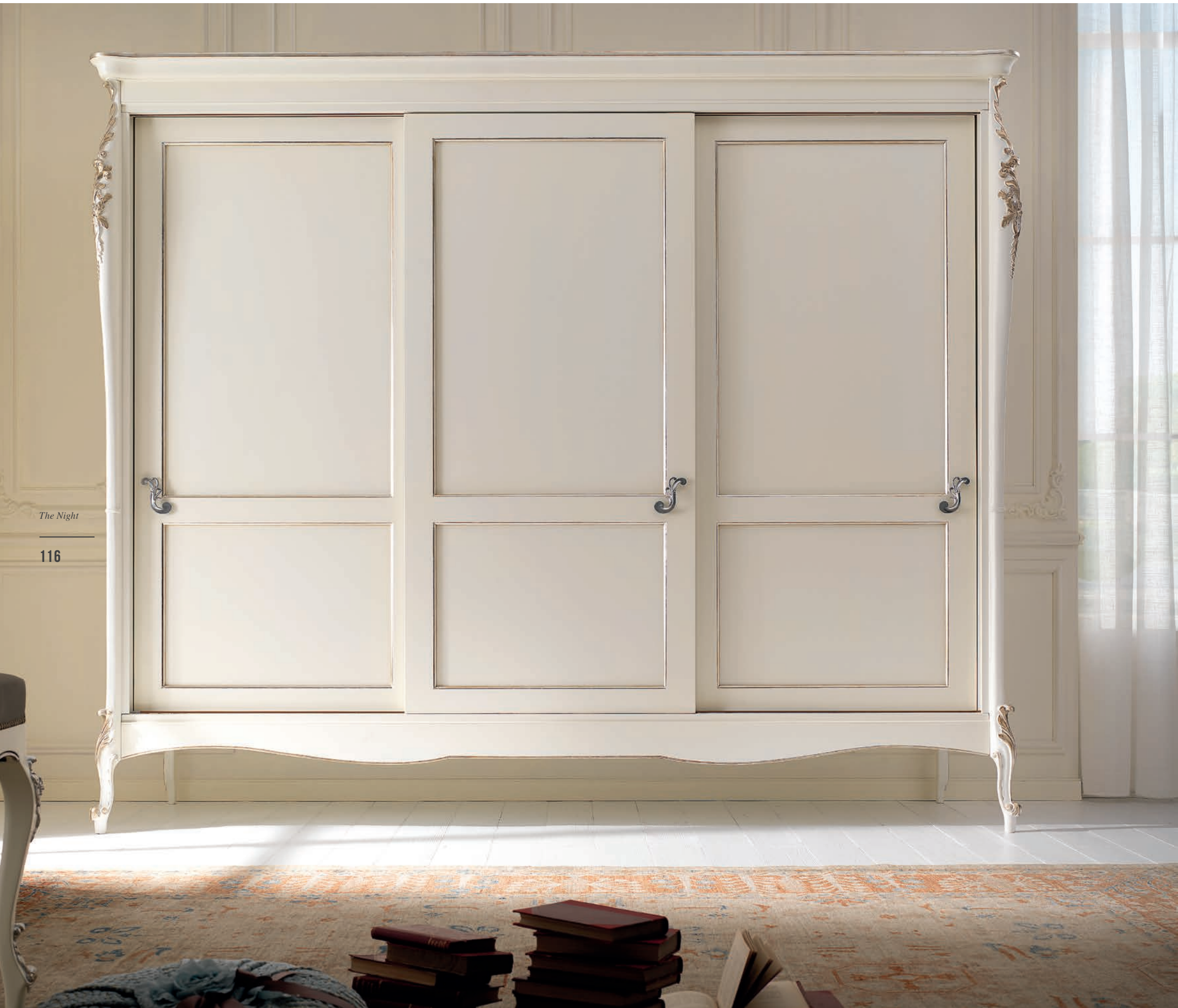
Art. 1035T Armadio tre Ante Scorrevoli / Wardrobe with three sliding doors L. 260 P. 69 H. 225