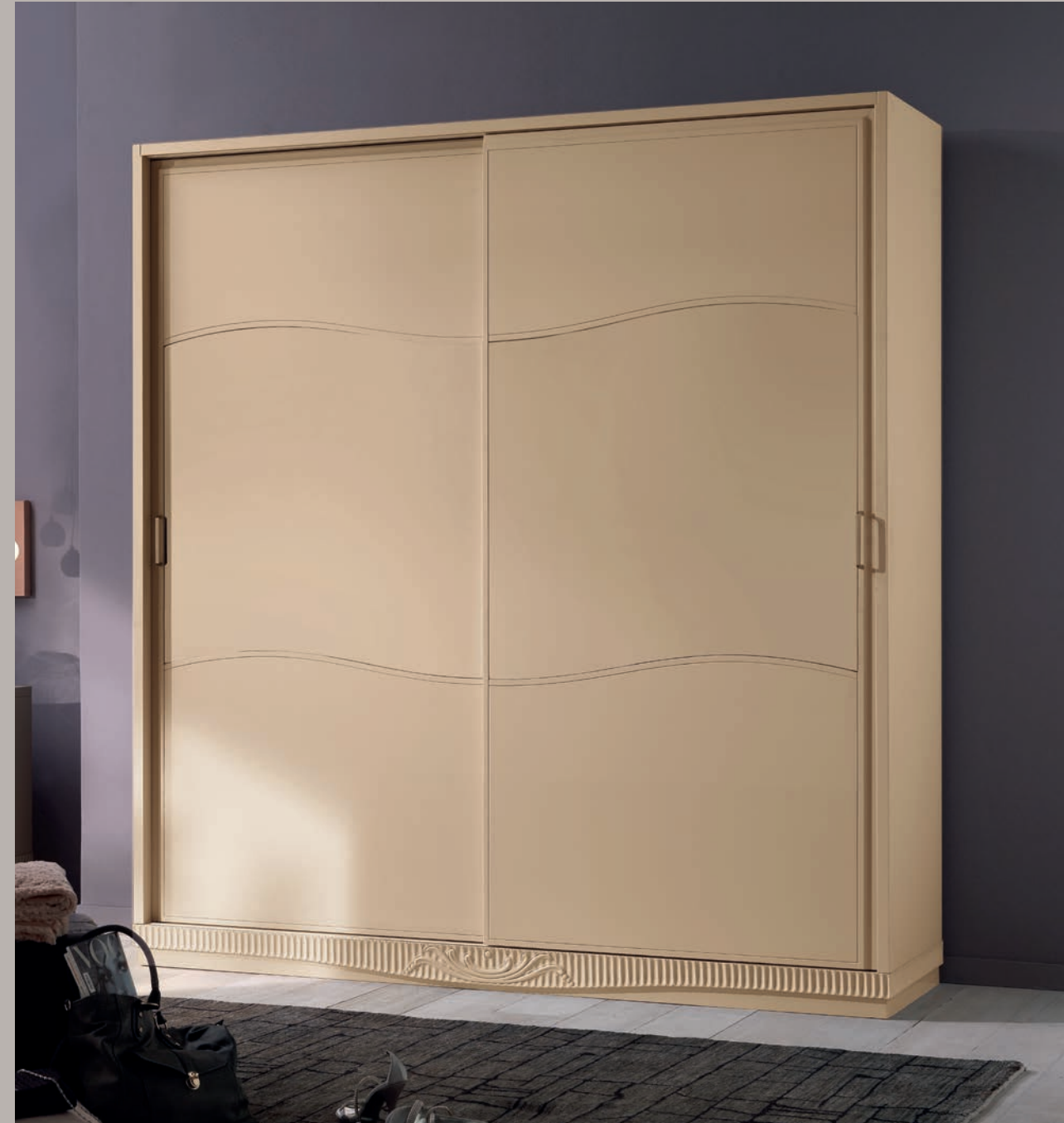
Art. 1237T Armadio ante scorrevoli / Wardrobe with sliding doors L. 202 P. 61 H. 219