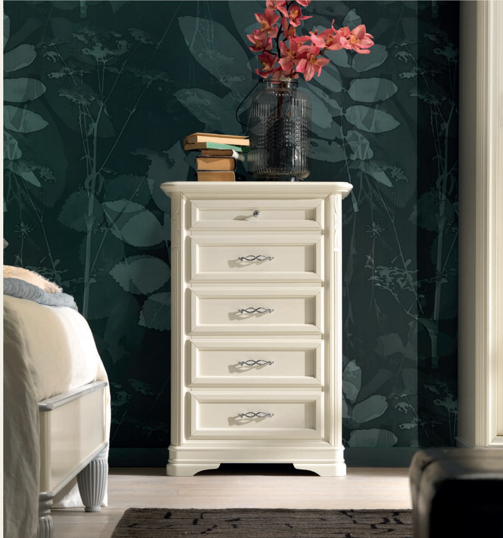
Art.628T Cassetiera / Small chest of drawers L. 65 P. 42 H. 100