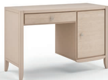
2045T Scrivanie portafriigo / Single pedestal desks Decoro Onda L. 124 P. 56 H. 81