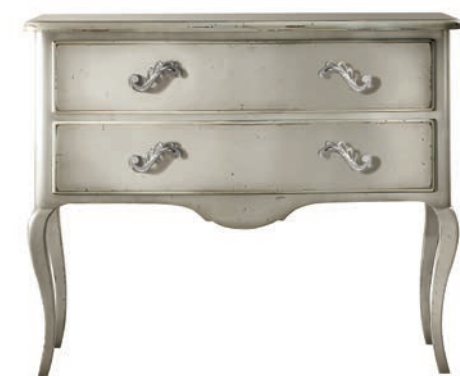
1750T Comò / Chest of Drawers L. 125 P. 52 H. 98