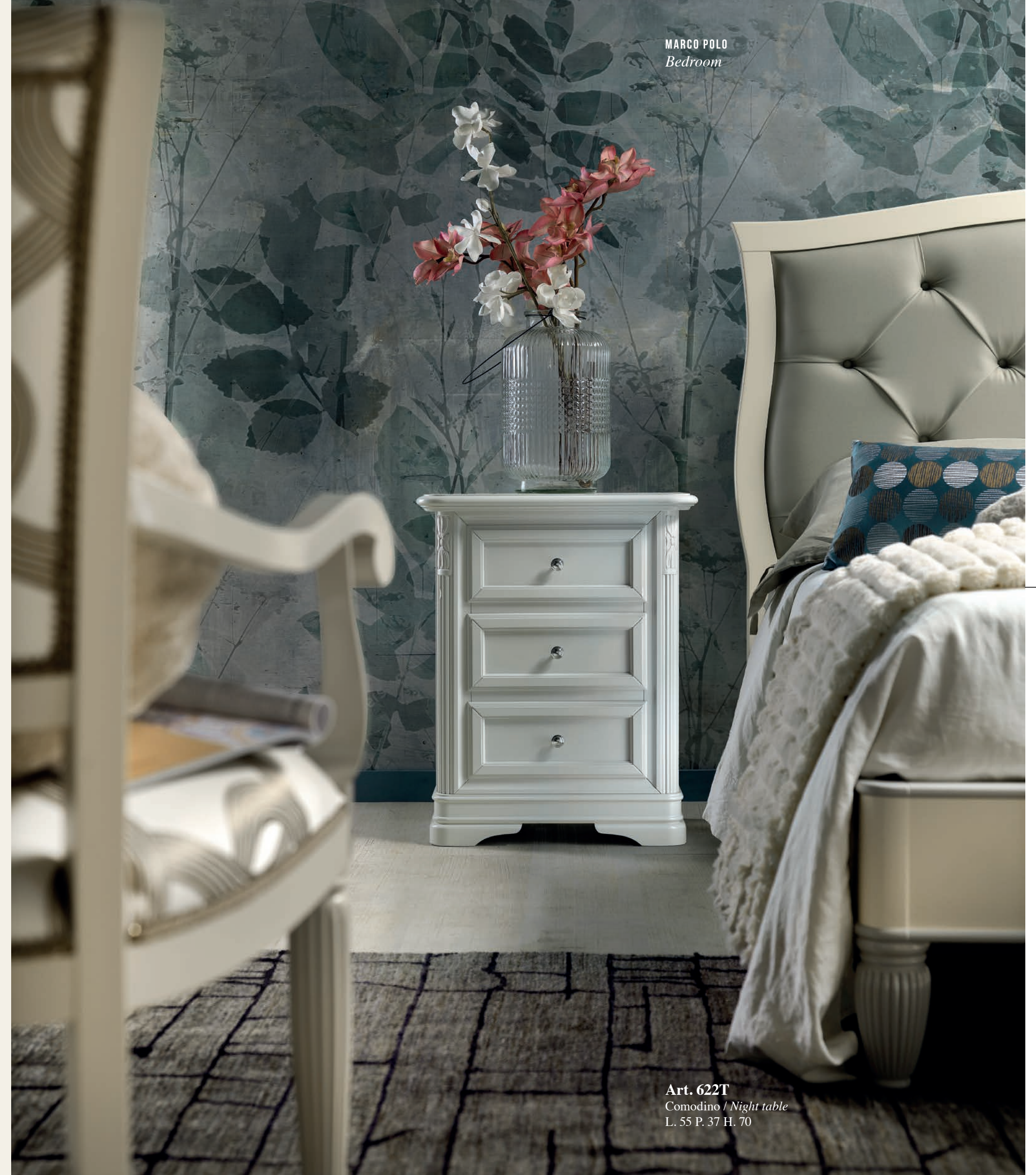
Art. 622T Comodino / Night table L. 55 P. 37 H. 70