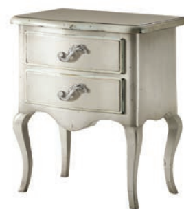
1751T Comodino / Night Table L. 57 P. 38 H. 67,5