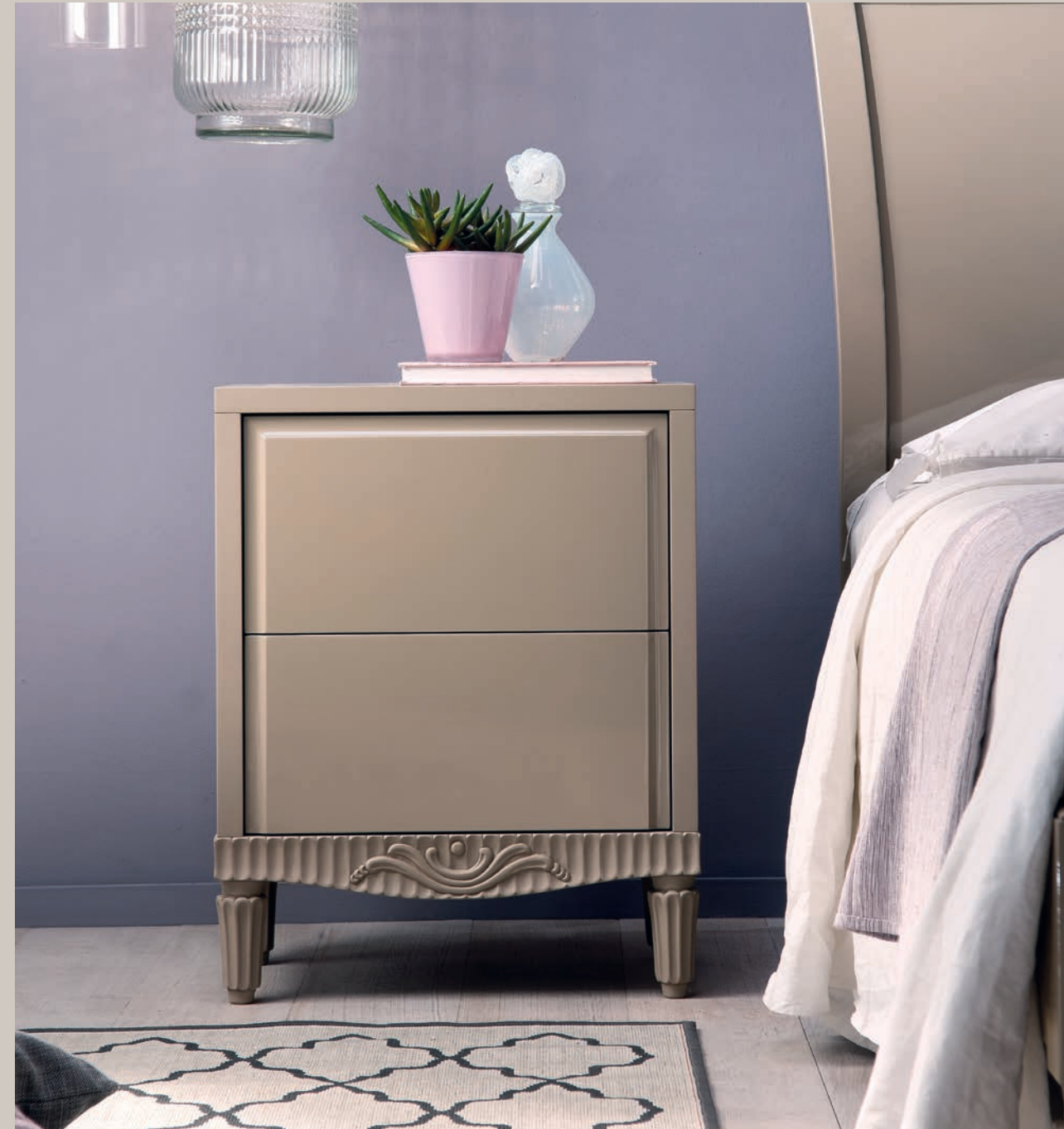
Art. 1229T Comodino due cassetti / Night table with two drawers L. 55 P. 34 H. 70