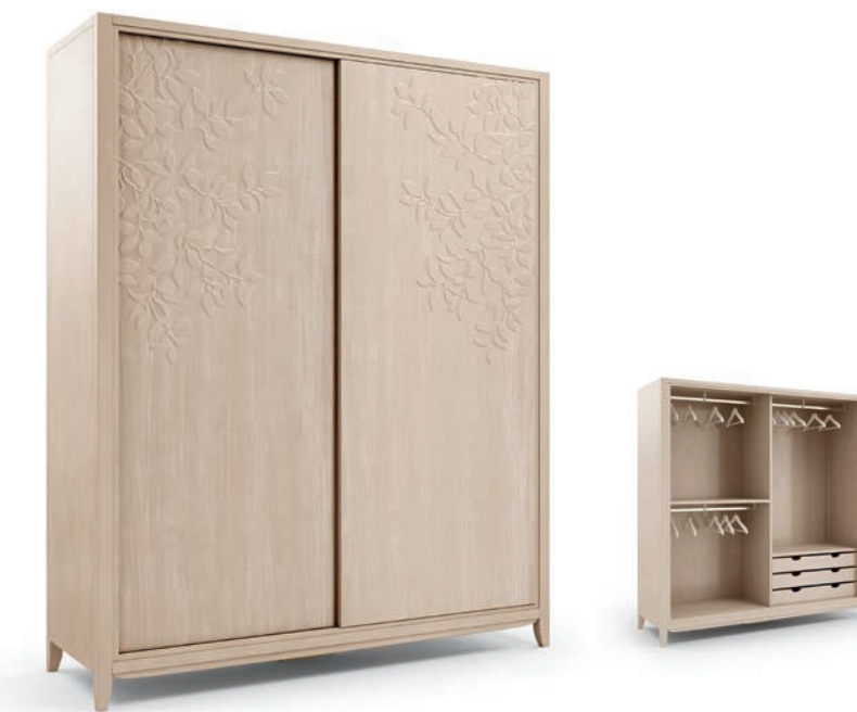
2037TF Armadio scorrevole / Wardrobe with sliding doors Decoro Foglia L. 200 P. 64 H. 220 Eden Collection / pag. 39