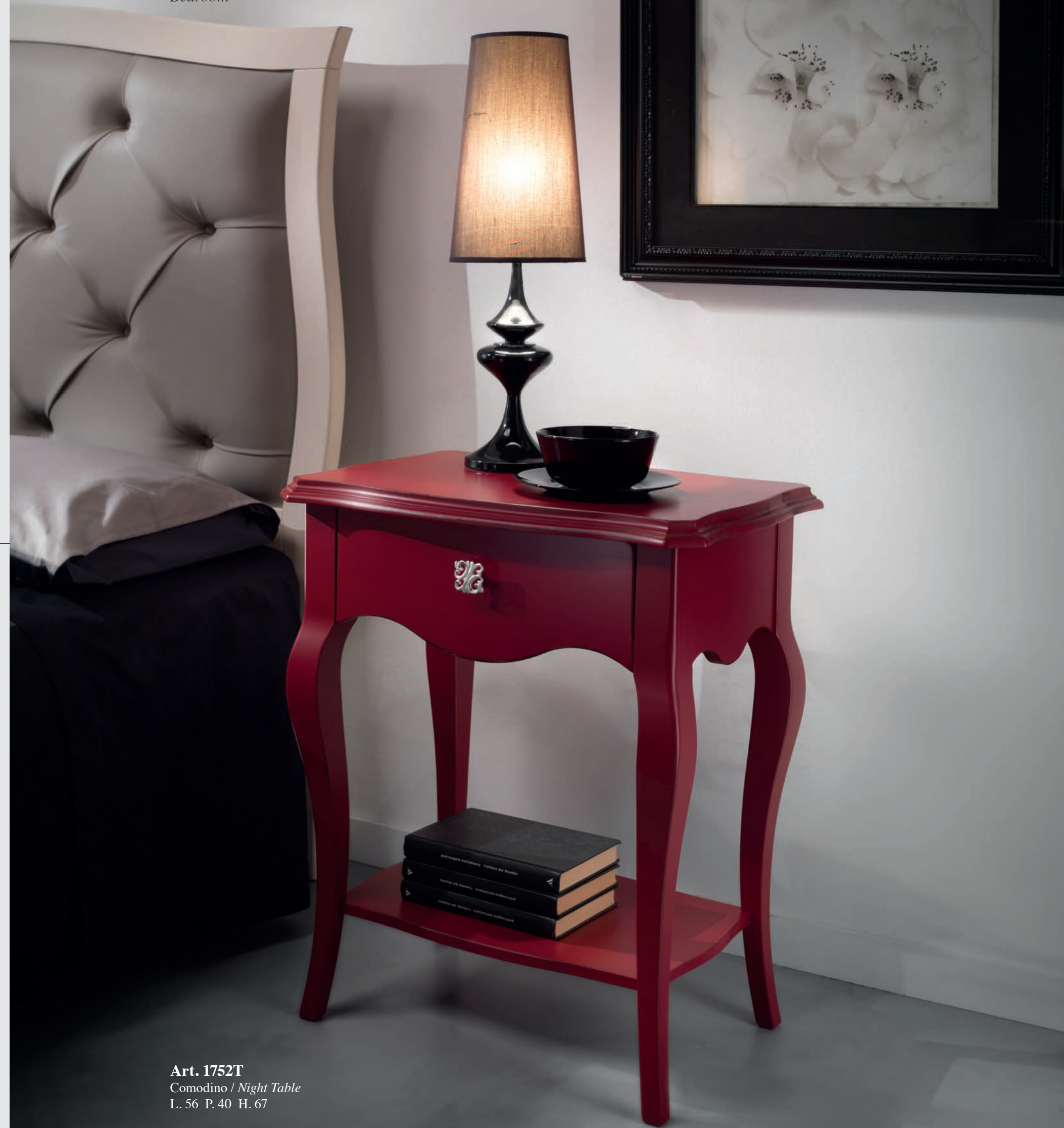
Art. 1752T Comodino / Night Table L. 56 P. 40 H. 67