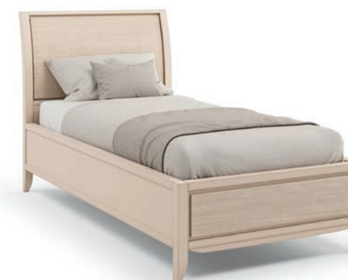
2028T Letto singolo (Rete materasso da 90x190 cm) / Single size bed (Bed frame 90x190 cm) Decoro Onda L. 99 P. 208 H. 1203