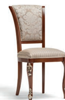
1004T Sedia / Chair L. 54 P. 59 H. 101 Venere Collection / pag. 129