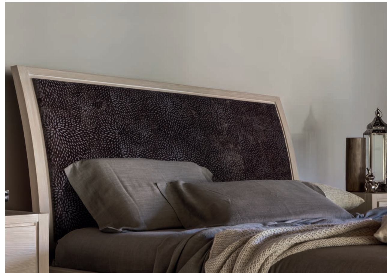
Art. 2074TS Letto contenitore matrimoniale imbottito / Double size bed with storage box and upholstered headboard L. 170 P. 209 H. 125

A light leaf décor or a soft fabric to add personality to the headboard. Two versions, one unique style.