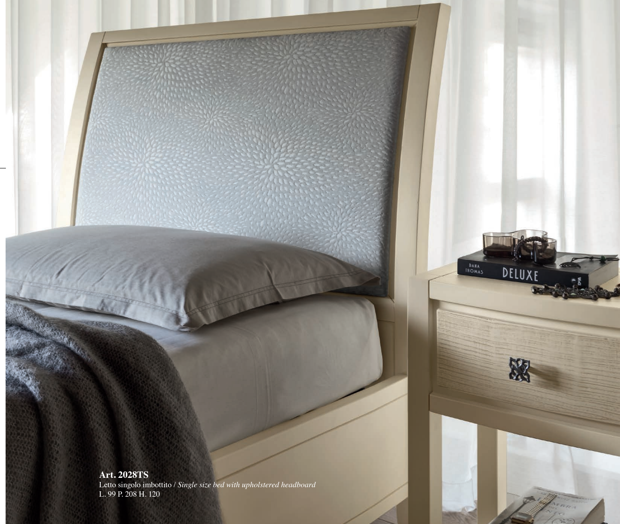
Art. 2028TS Letto singolo imbottito / Single size bed with upholstered headboard L. 99 P. 208 H. 120