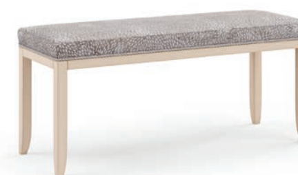
2034T Panchetta / Bench L. 124 P. 44 H. 49