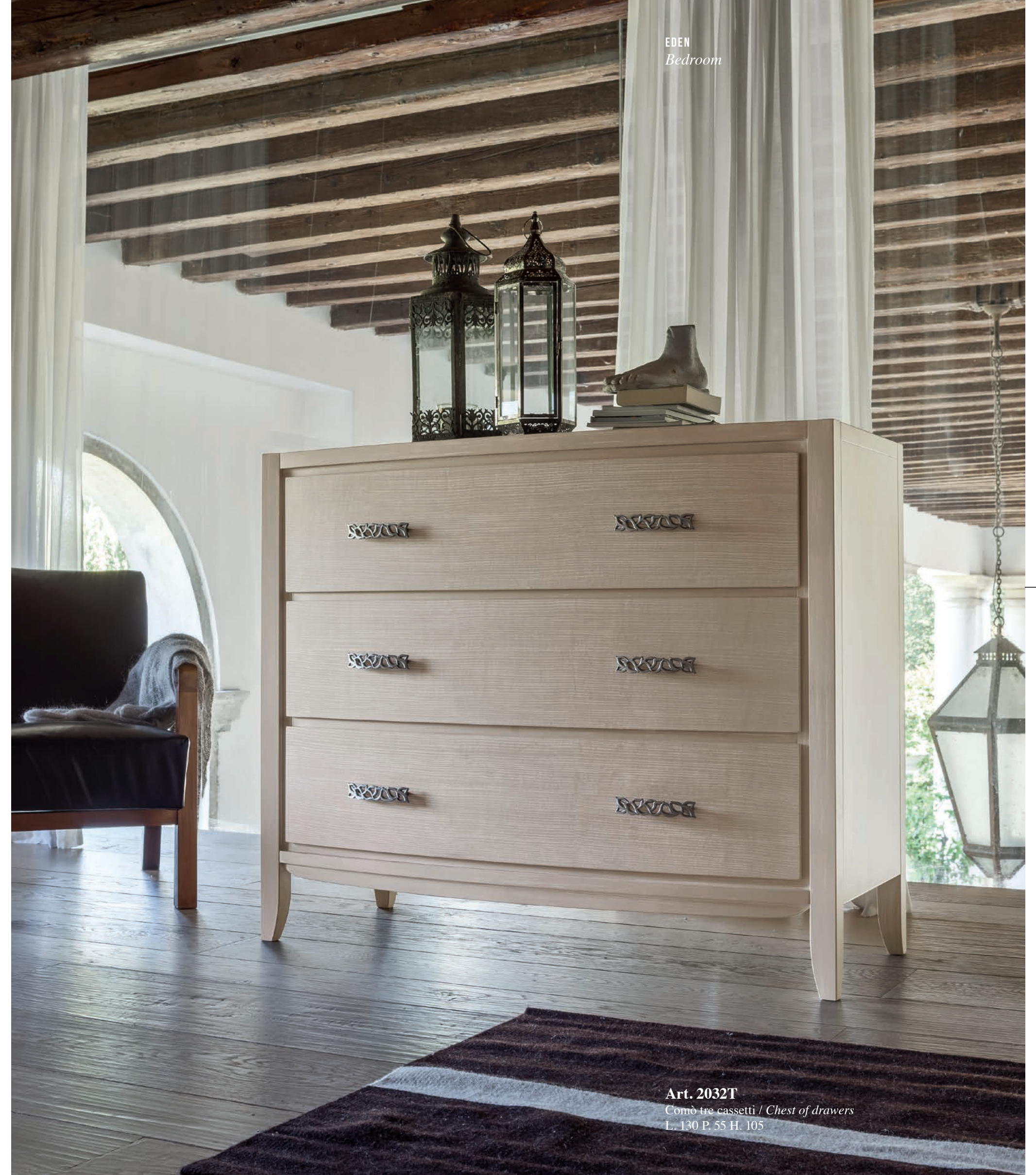
Art. 2032T Comò tre cassetti / Chest of drawers L. 130 P. 55 H. 105

The dresser changes the composition but retains its innate beauty. With or without décor, it is an essential element for storing as well as furnishing.