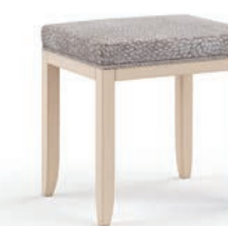
2039T Panchetta / Bench L. 55 P. 44 H. 49