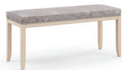
2034T Panchetta / Bench L. 124 P. 44 H. 49 Eden Collection / pag. 43