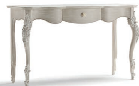
1014T Consolle / Console L. 142 P. 46 H. 83 Venere Collection / pag. 123