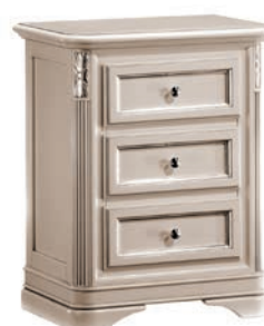
622T Comodino / Night table L. 55 P. 37 H. 70