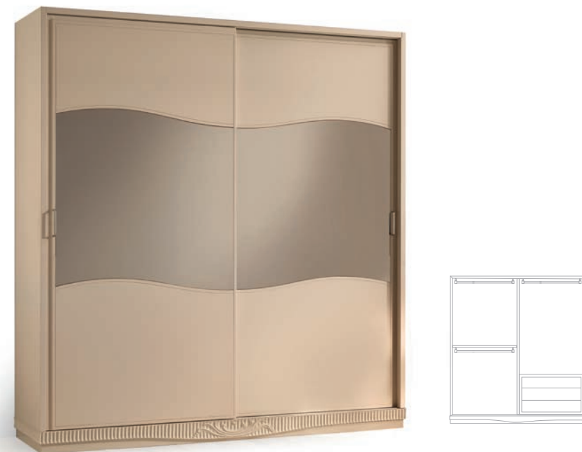
1237TS Armadio ante scorrevoli con specchi / Wardrobe with sliding doors and mirrors L. 202 P. 61 H. 219 Aria Collection / pag. 21