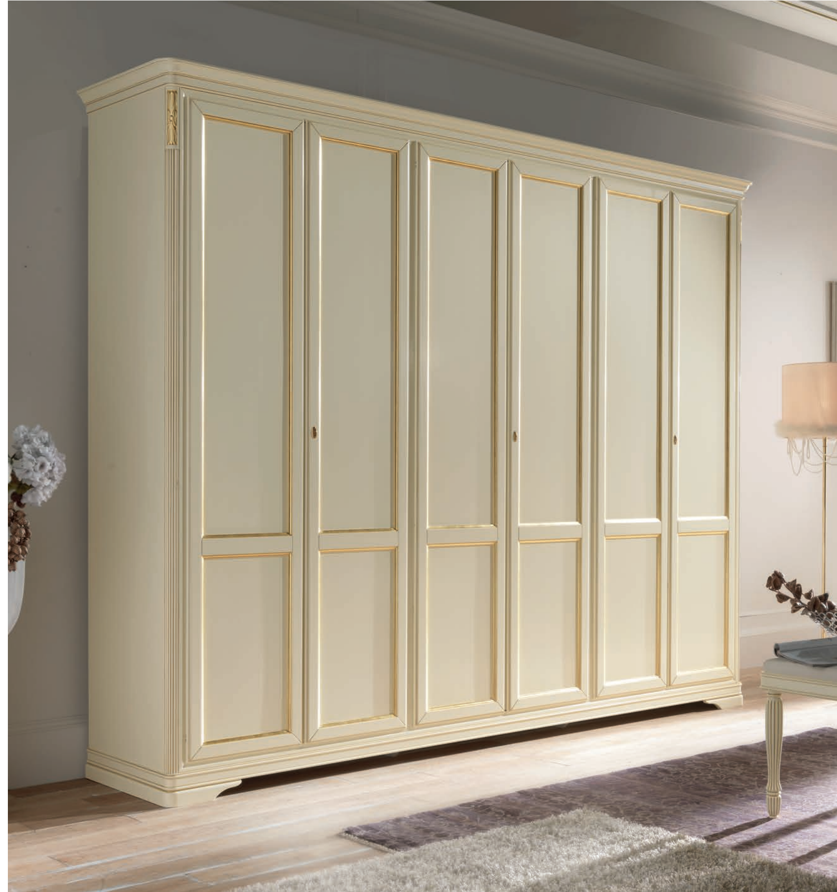
Art. 625T Armadio / Guardrobe L. 310 P. 67 H. 250