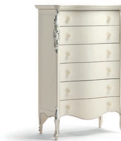
1036T Cassettiera / Chest of Drawers L. 86 P. 47 H. 132 Venere Collection / pag. 114