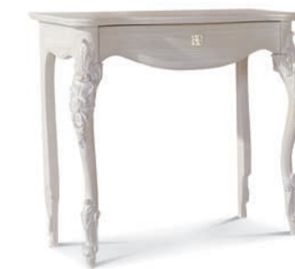
1023T Consolle / Console L. 90 P. 46 H. 83 Venere Collection / pag. 132