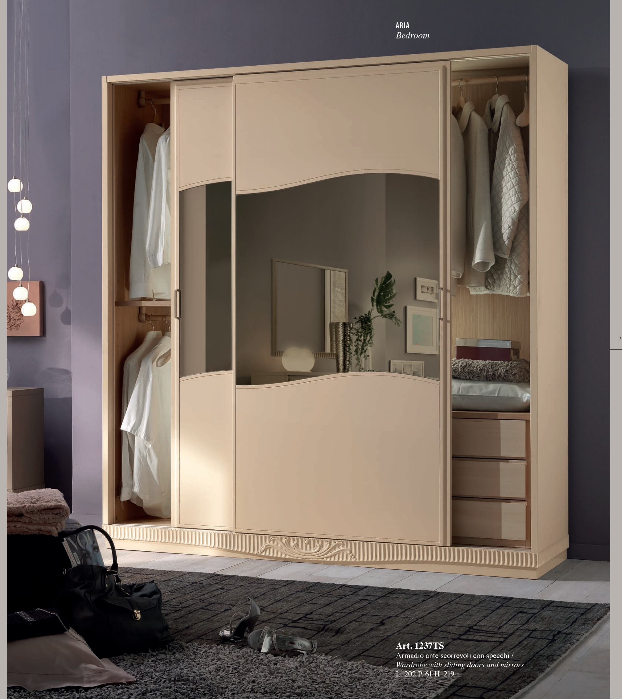
Art. 1237TS Armadio ante scorrevoli con specchi / Wardrobe with sliding doors and mirrors L. 202 P. 61 H. 219