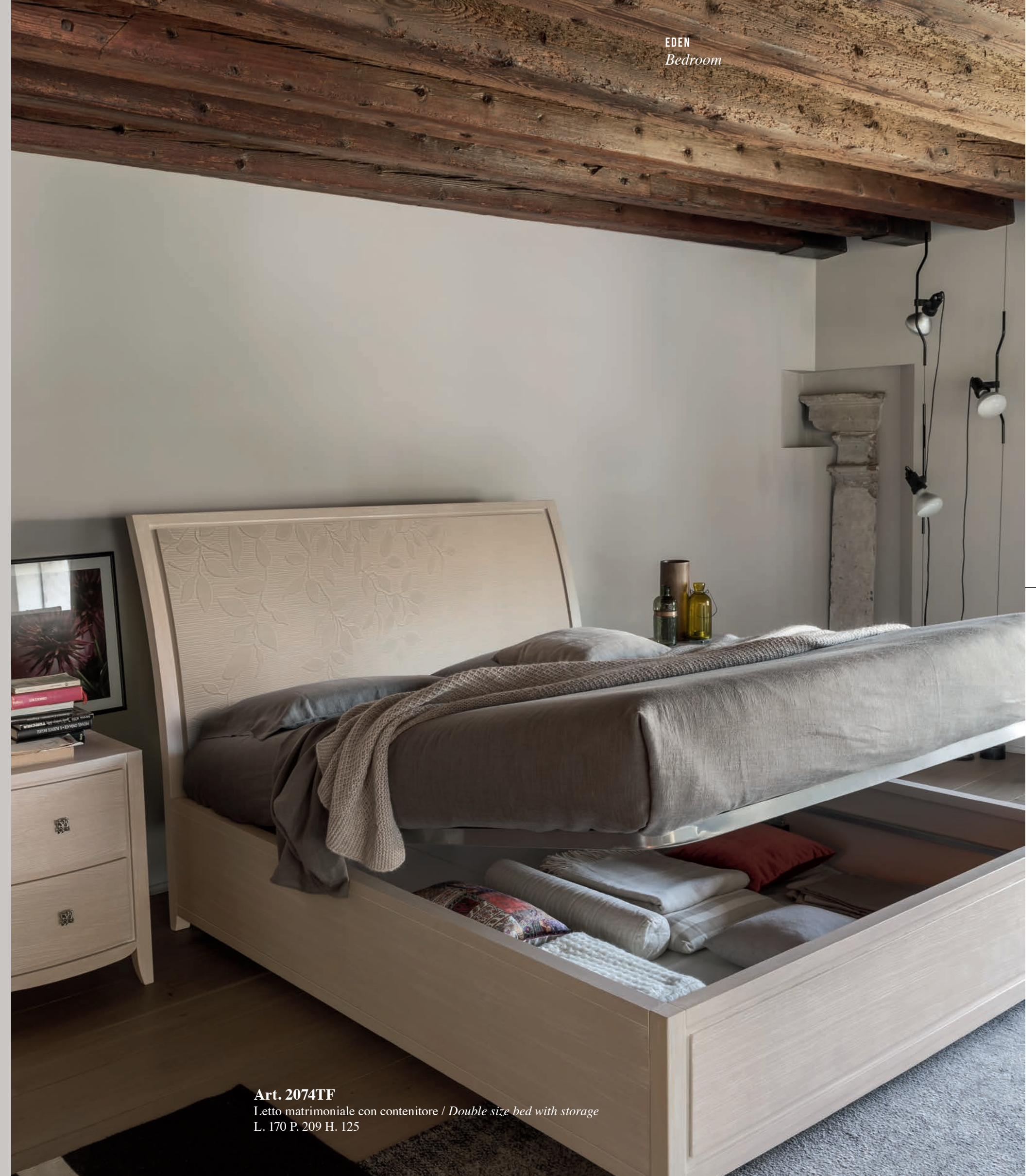
Art. 2074TF Letto matrimoniale con contenitore / Double size bed with storage L. 170 P. 209 H. 125

Elegant in form, practical in substance: the storage bed enhances the bedroom space, opening the door to new solutions. Style adapts to the needs of contemporary living and functionality rediscovers its refined side.