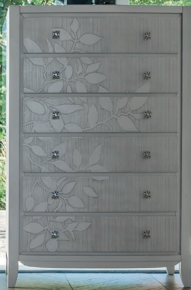
Art. 2036TF Cassetiera / Chest of drawers L. 85 P. 42 H. 130