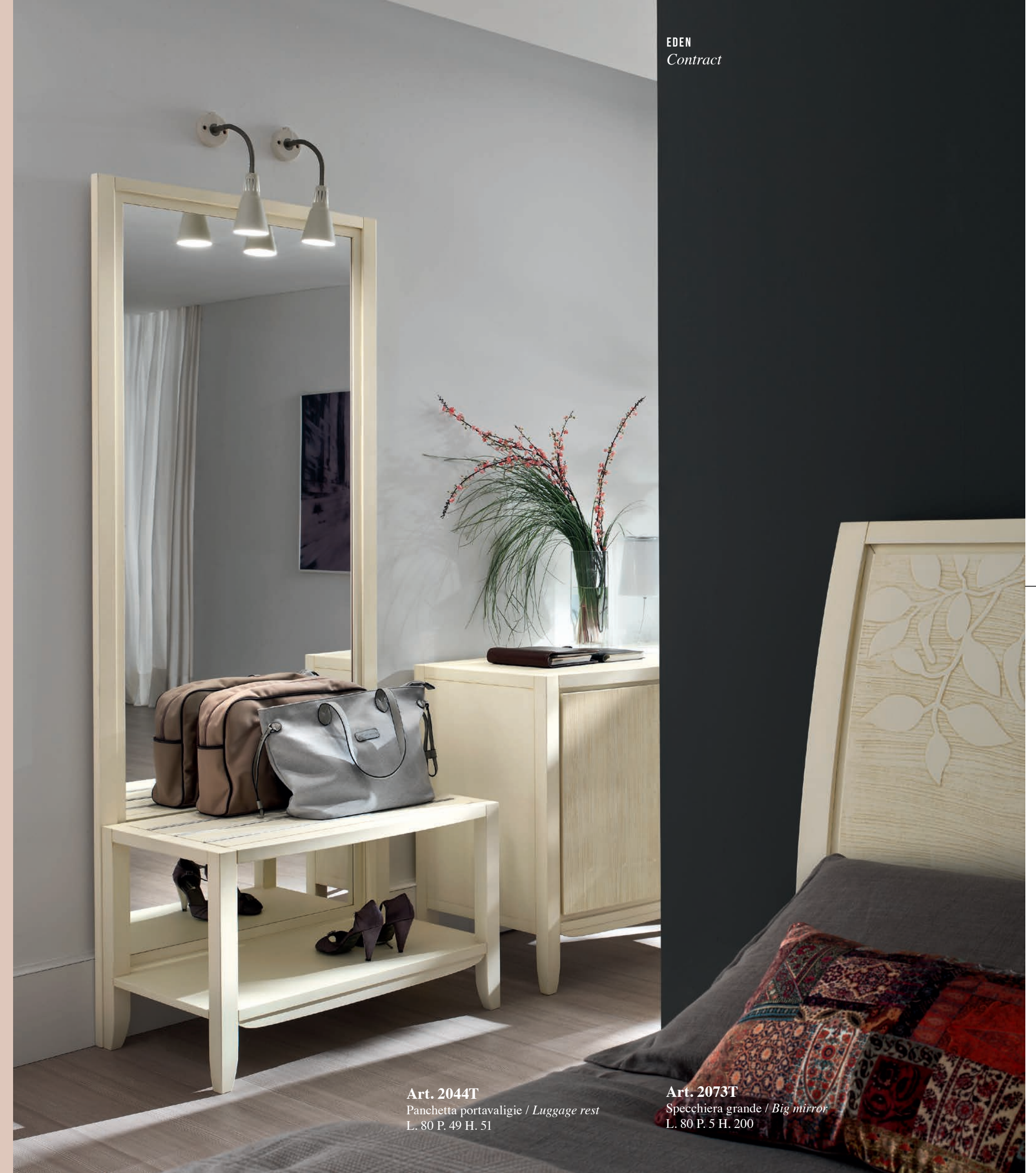
Art. 2044T Panchetta portavaligie / Luggage rest L. 80 P. 49 H. 51

The luggage rack with mirror completes the bedroom, for an even cosier and more organised setting. Unpacking becomes an elegant and practical experience.