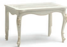
1044T Porta valigie / Luggage Rest L. 78 P. 47 H. 51 Venere Collection / pag. 145