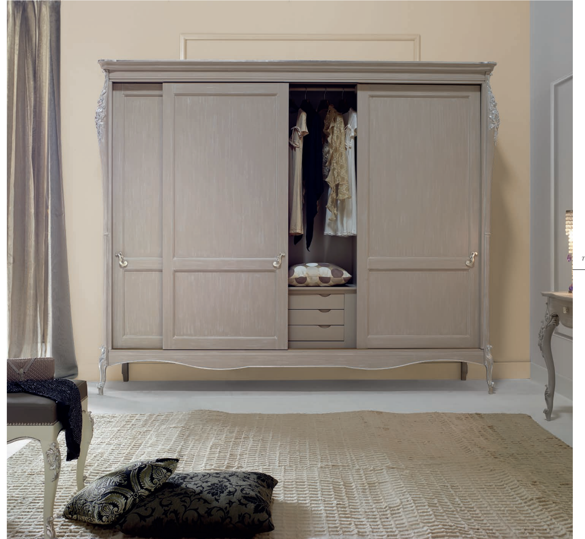
Art. 1030T Armadio tre Ante Scorrevoli / Wardrobe with three sliding doors L. 300 P. 69 H. 250