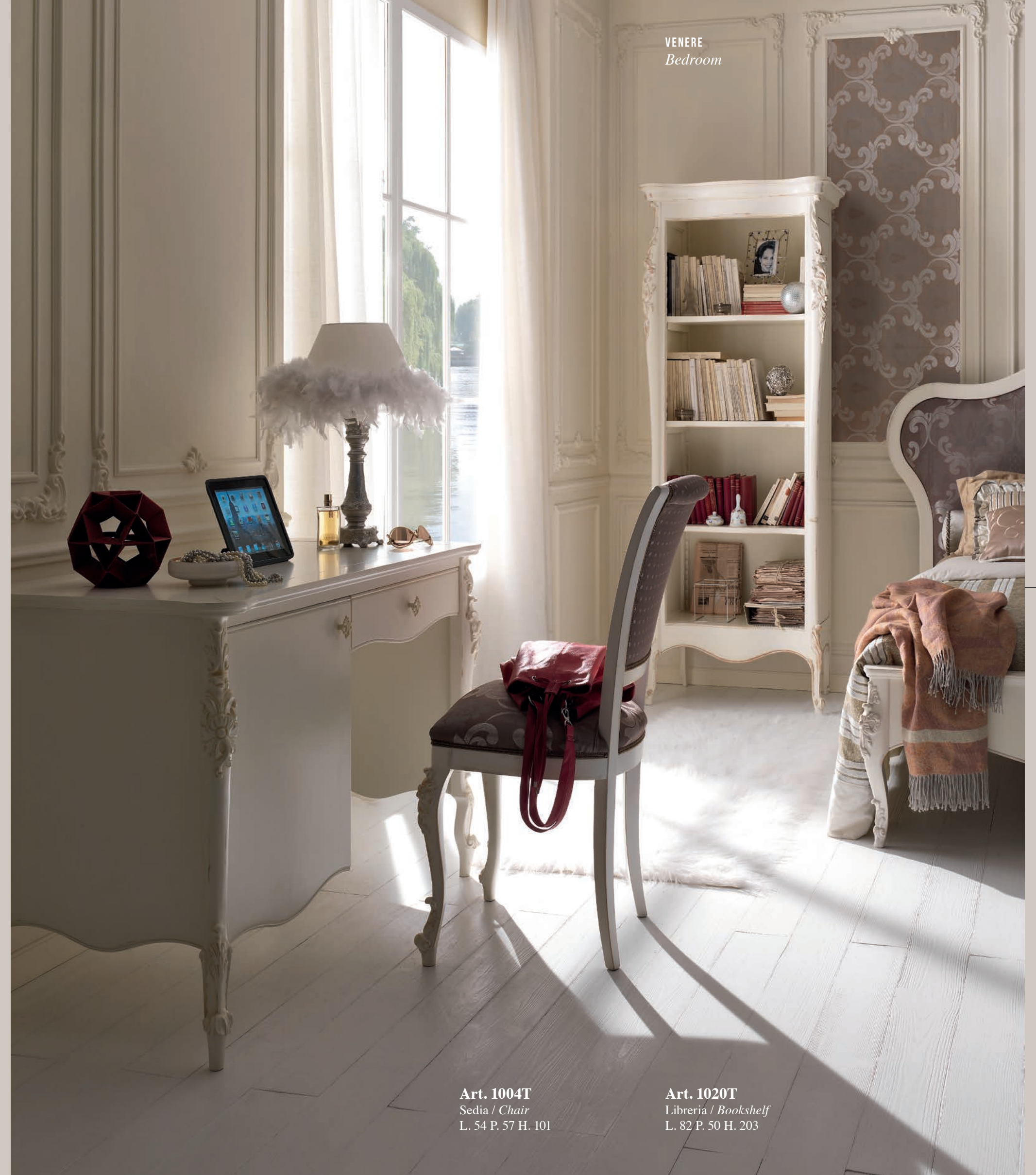
Art. 1004T Sedia / Chair L. 54 P. 57 H. 101

In the single room, the corner studio, with a small but functional desk equipped with side cabinet with one door compartment and a drawer.