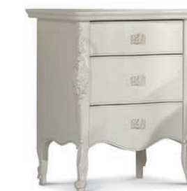
1029T Comodino tre cassetti / Night table L. 56 P. 41 H. 68