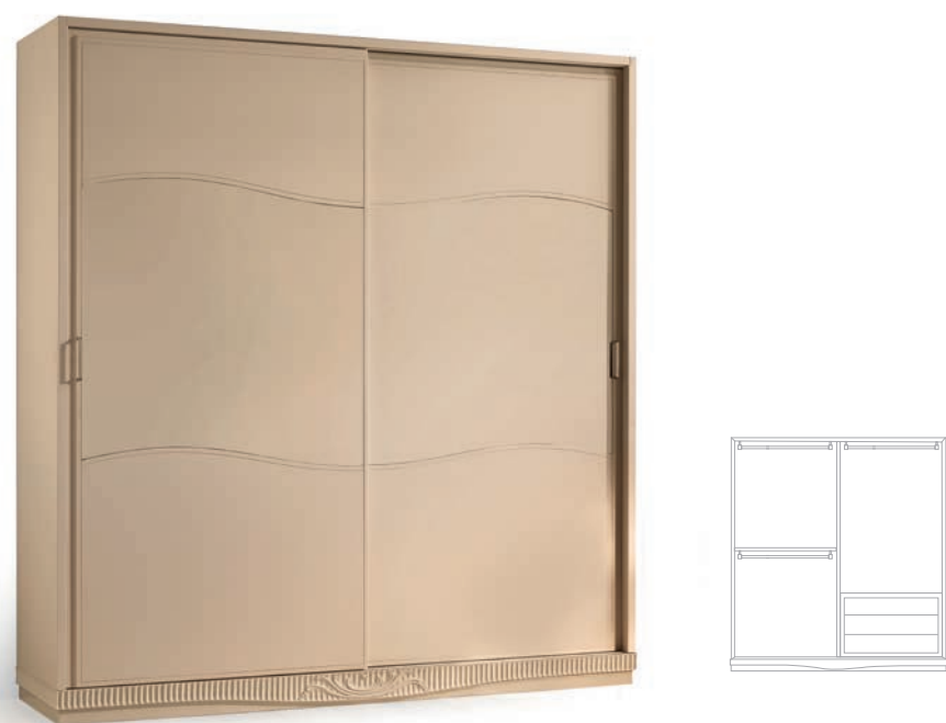
1237T Armadio ante scorrevoli / Wardrobe with sliding doors L. 202 P. 61 H. 219 Aria Collection / pag. 22