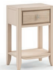
2033T Comodino / Night table Decoro Onda L. 44 P. 33,5 H. 67